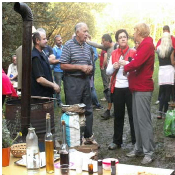
Turistično društvo Moravče

Ob Račo pa vas vabimo na sprehod v lepih jesenskih dneh.