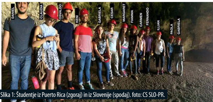
Slika 1: Študentje iz Puerto Rica (zgoraj) in iz Slovenije (spodaj).