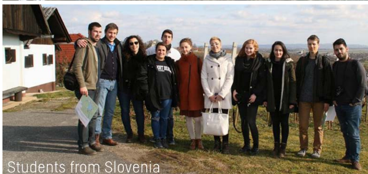
Students from Slovenia