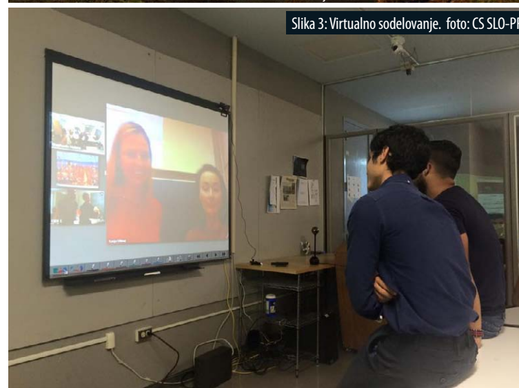
Slika 3: Virtualno sodelovanje.