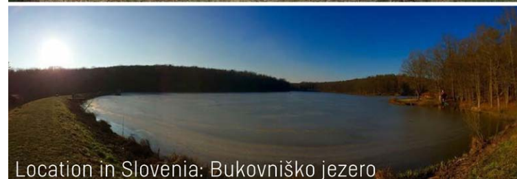
Location in Slovenia: Bukovniško jezero