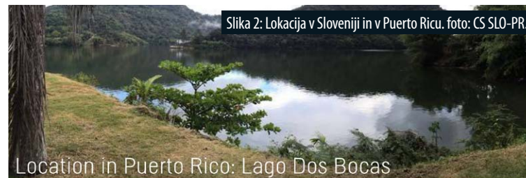
Slika 2: Lokacija v Sloveniji in v Puerto Ricu.