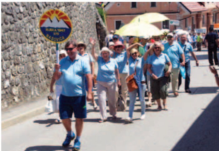
Vsakoletni sprevod.

Pomen tabora, ki se ga je do zdaj skupaj udeležilo več kot 150.000 pevcev, je zaradi ohranjanja izročila slovenske pesmi, zborovskega petja in njune popularizacije