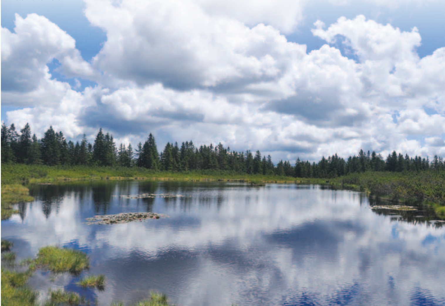
Ribniško jezero.