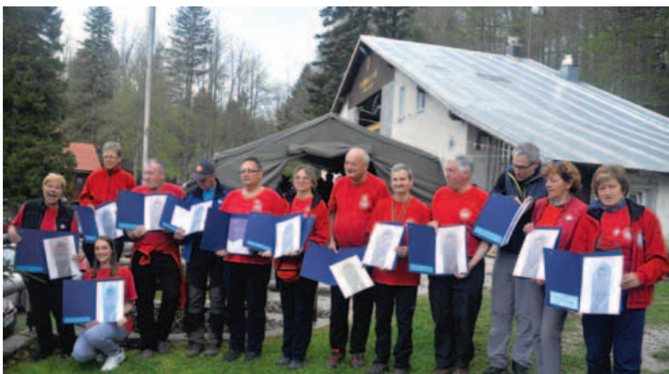
Nagrajenci Planinske zveze Slovenije.

V mozaik 110 let PD Snežnik je planinska skupina (PS) Bazovica v preteklih petnajstih letih vgradila vsaj en kamenček. Zato sta se obe društvi odločili, da lepa jubileja proslavita skupno in predvsem delovno. Za osrednji dogodek sta pripravili dva planinska pohoda, dve turnokolesarski turi in seveda proslavo pri domu na Sviščakih. Pohod po daljši pohodniški turi – po delu Poti prijateljstva Snježnik - Snežnik, ki jo upravljata PD Snežnik na slovenski in HPD Platak na hrvaški strani – je potekal od Klanske police nad Gumancem do vrha Snežnika in naprej do Sviščakov. Tega se je udeležilo dvanajst najmočnejših pohodnikov. Preostalih več kot sto pa se jih je udeležilo vzpona na Snežnik od Sviščakov. Pohoda je popestrila dvajsetminutna ploha, tako kot na prvem pohodu planinske skupine leta 2002, ki je bil prav tako izpeljan na Snežnik. Slovesnosti pri domu na Sviščakih sta se udeležili vodstvi Planinske zveze Slovenije (PZS) in Hrvaške planinske zveze (HPZ, Hrvatski planinarski savez), ki sta dan prej tam imeli redno letno srečanje. Za neutrudno delo pri razvoju planinstva je