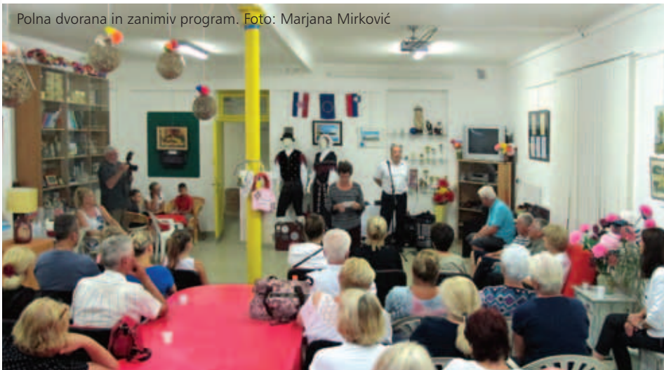
Polna dvorana in zanimiv program.