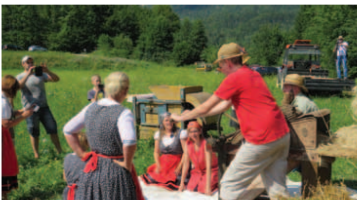
Žetev ovsa kot nekoč.