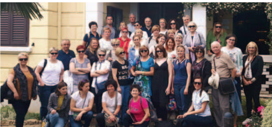
Za spomin.