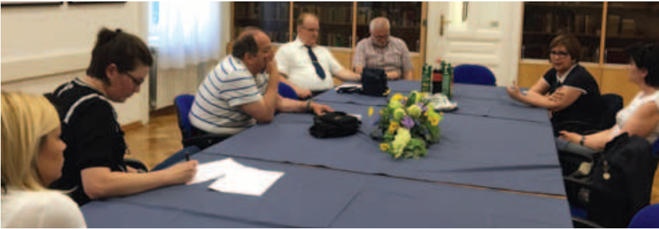
Pobuda za vrtec gre dalje.