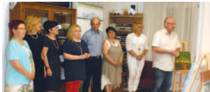
Z razstave.

V društvu se že več let zapored z razstavami predstavlja likovna skupina Društva železničarjev slikarjev, ustanovljena pred dvajsetimi leti, ki šteje trideset članov, izključno zaposlenih in upokoencev Hrvaških železnic. Člani prihajajo iz različnih krajev Hrvaške, od Zagreba z okolico, Siska, Koprivnice, Varaždina, Osijeka, Knina Splita in Reke. Skupina se je predstavila na več kot petdesetih skupnih razstavah na Hrvaškem in tudi tujini, v Franciji, Italiji, Nemčiji, Belgiji, Češki in na Madžarskem.