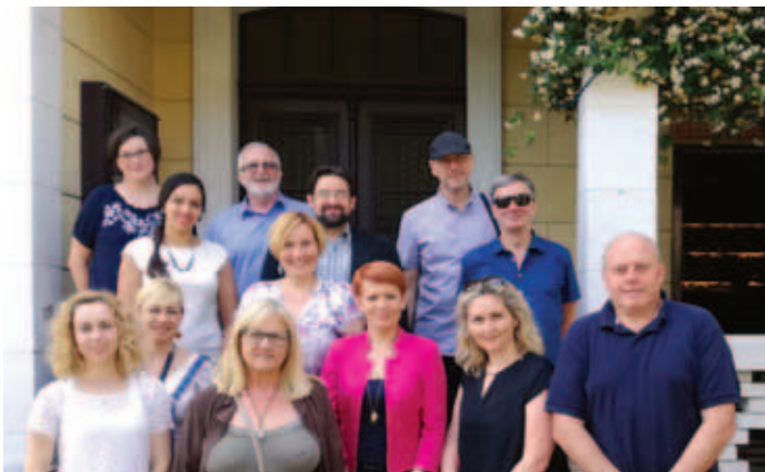
Del zadovoljnih udeležencev.

Društvo EU korak je predstavilo možnosti za mednarodno sodelovanje v okviru