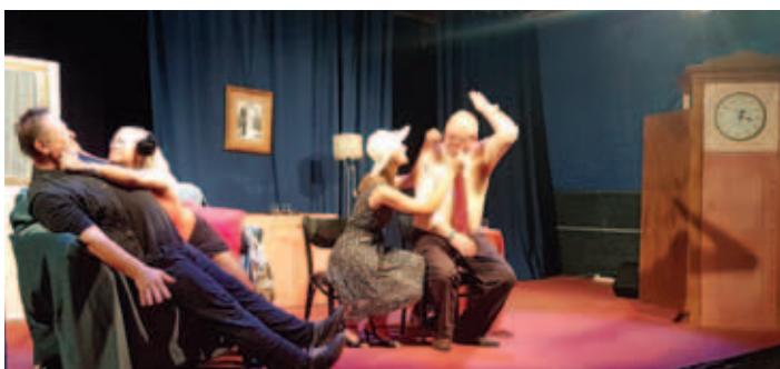
Iz predstave.