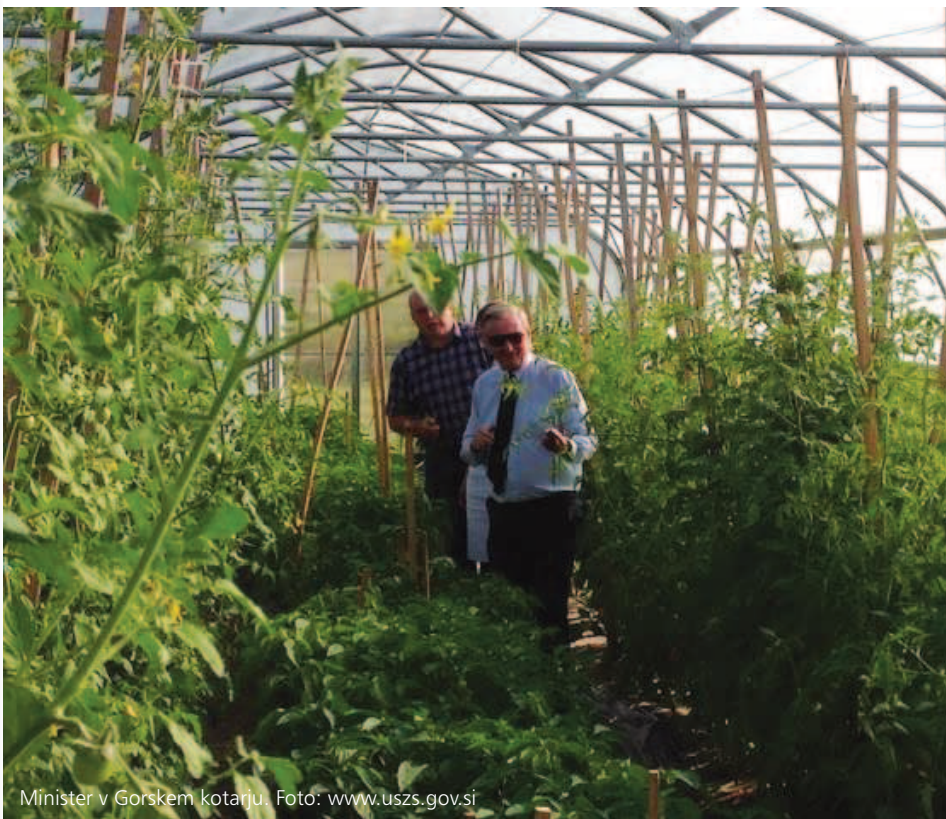
Minister v Gorskem kotarju.