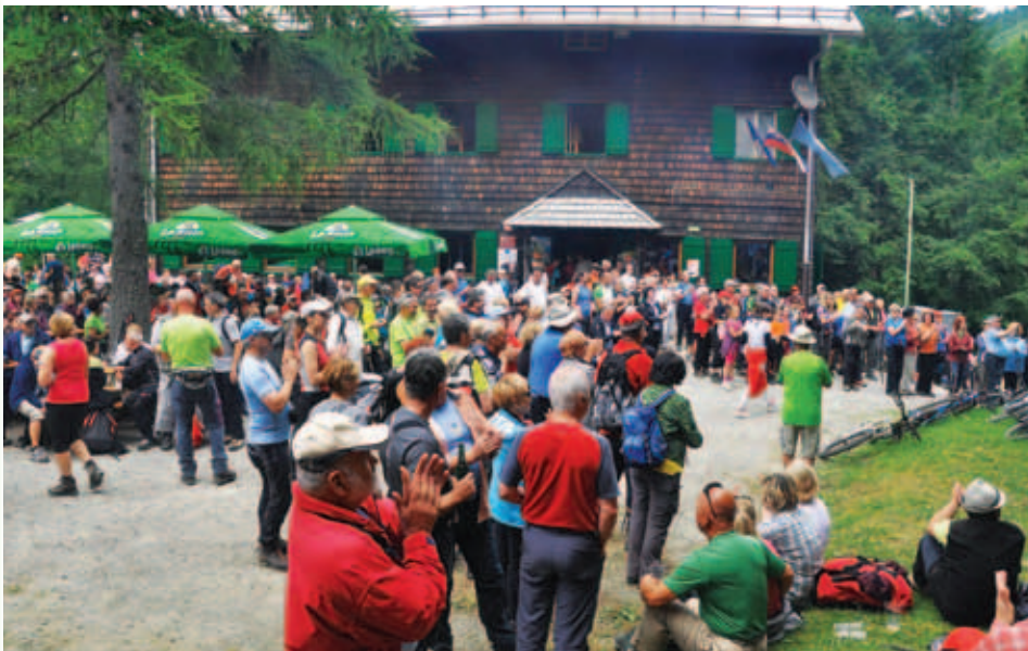
Množica planincev pri Domu pod Storžičem.