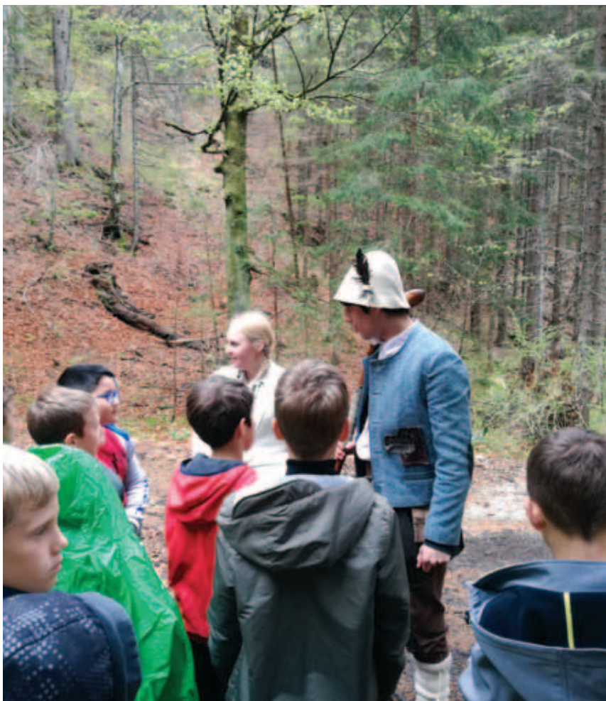
Učenci slovenščine v Kekčevi deželi.

"Obiskali smo Kranjsko Goro, prva točka ogleda je bila več kot tristo let stara Liznjekova domačija, premožna kmetija iz 18. stoletja. Bilo je zanimivo videti ohranjeno pohištvo in spoznati takratni način življenja v Kranjski Gori. Najlepši del izleta pa je bil obisk Kekčeve dežele: lovil nas je hudobni Bedanec, videli smo like, kot so Mojca, Brincelj, teta Pehta in seveda Kekec. Rešili smo Mojco, se spuščali po toboganu, poiskali skrivni prehod. Po ogledu Kekčeve dežele smo se odpravili na koso, se zatem še sprehodili po Kranjski Gori in kupili zadnje spominke. Bilo nam je lepo in zanimivo videti ne le, kakšni so nekateri izmed likov, o katerih smo se učili pri pouku, temveč tudi gledati čudovite vrhove v okolici Kranjske Gore," so med drugim zapisali učenci OŠ Pečine na šolski spletni strani www.os-pecine-ri.skole.hr in podobno tudi njihovi vrstniki iz OŠ Kozala na strani www.os-kozala-ri.skole.hr .