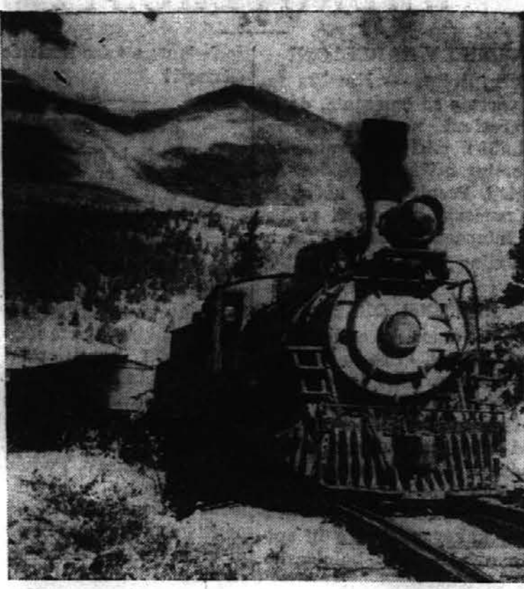
"Old 76", 60 let stara lokomotiva (slovenski očanci so rekli "Luka-Matijs") sopiha na svoji zadnji poti iz Climaxa v Leadville, Colo., preden so jo poslali v Alasko, kjer jo bodo rabili še nadalje. Sedaj ko sta Colorado in Southern železnici še na zadnjih 15 milj proge spremenili ozki tir na normalni tir, te stare lokomotive ne potrebujejo več.

svojim članom. Pomnite, da v ZSZ lahko pristopijo tudi člani druge narodnosti. Vse kar potrebuje oseba, da je zmožna za vstop v ZSZ je, da je bele polti, zdrava, brez telesnih napak in pa, ki ni še prekoračila starosti 55 let.