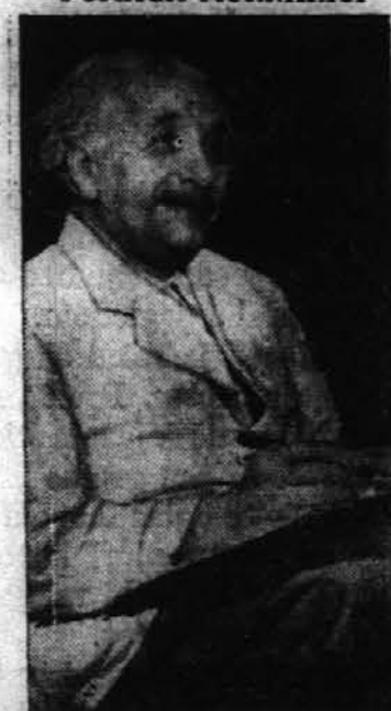
Mornarica je pridobila izredno do- bre možgane. Ko se je znanstvenik Dr. Albert Einstein priglasi za delo v ordnančnem uradu. Tukaj vidimo slavnega matematika pri delu v njegovem domu v Princetonu. Pribežal je izpod nazijske vlade, sedaj pa je ameriški državljan.