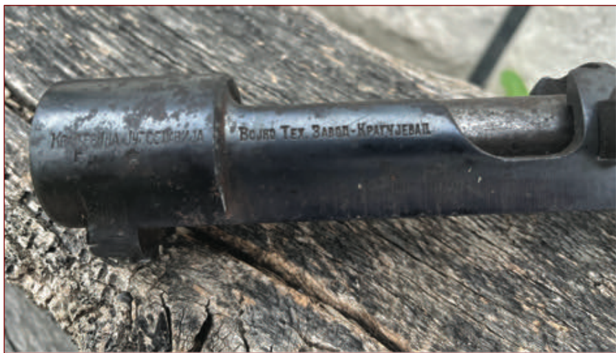
Slika 3: Napis na zaklepu jugoslovanske puške dokazuje, da je bila izdelana v Vojnotehničnem zavodu v Kragujevcu.