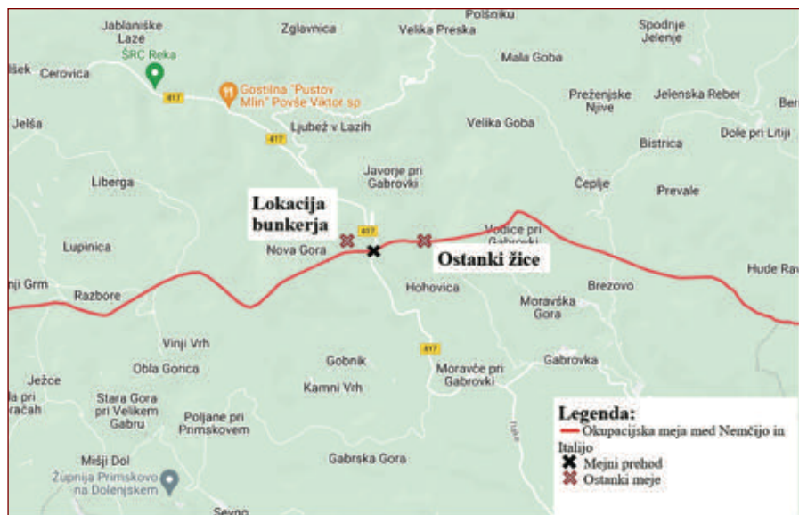
Slika 2: Meja med okupatorjema na Javorskem Pilu

Na spodnjem zemljevidu (slika 2) je z rdečo zarisana meja, ki je potekala južno od Litije, in sicer čez Javorski Pil, kjer je stal tudi mejni prehod in je na zemljevidu označen s črnim križcem. Glede na ostanke, ki jih je mogoče videti še danes, sem na zemljevid z rdečima križcema označila tudi lokacijo, kjer še leži žica, ki je ostala od vojnega obdobja, in lokacijo, kjer naj bi ob meji stal bunker. Ostanke le-tega sicer ni, je pa lokacija začrtana glede na pričevanja domačinov.