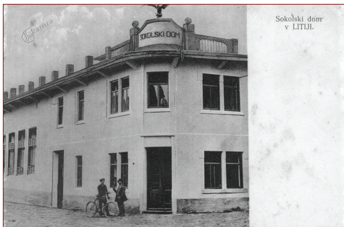
Slika 1: Sokolski dom v Litiji