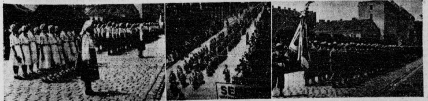
Slovenski študentje in dekleta v krojih pričakujejo pred ljubljanskim kolodvorom prihod čeških Orlov in Orli. V sredi: Sprevod čeških Orlov, pa ljubljanskih ulicah.