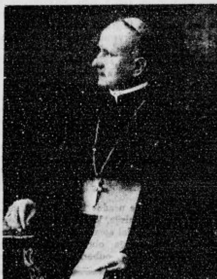
Sarajevski nadškof dr. Ivan Šarić je v nedeljo slovesno praznoval 30-letnico škofovskega posvečenja.

d Med plamtečim govorom mu je izpadel zdrav zob. Izredno vroče zborovanje so imeli pred nekaj dnevi učitelji iz okraja Sremska Mitrovica. Dve ostro ločeni skupini sta nastopili na zborovanju. Opozicija je krivila odbor raznih nepravilnosti, zlasti pa nepoštenosti pri volitvah odbora, medtem ko so člani odbora z ognjevitimi govori te obdolžitve zavračali. Kako »vroče« je bilo na obnem zboru, dokazuje najbolj primer nekega učitelja, ki mu je med silno plamtečim govorom izpadel — zdrav zob. Dogodek je vsem, tudi najbolj razgretim, privabil smeh na usta.