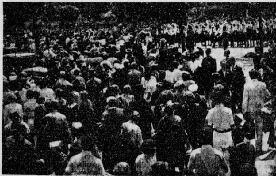
Množice pozdravljajo češke Orle pred ljubljanskim kolodvorom.

d Važna seja ministrskega sveta. Ob triletnici vlade dr. Stojadinoviča je bila v Beogradu seja ministrskega sveta. Med drugim je finančni minister podal poročilo, da je zdaj že zagotovljen vpis novega 6% notranjega posojila v iznosu 2 milijard dinarjev. Na tej podlagi je ministrski svet izdal odlok, s katerim se bo to posojilo porabilo: a) za gradnje novih državnih cest, b) za ureditev