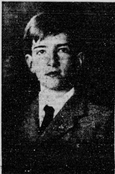
Nj. Vel. kralj Peter II. pokrovitelj mladinskega tabora v Ljubljani.

Slovenska mladina, narod te ljubi in občuduje, narod zaupa v tebe! Pokaži, da je to upanje popolnoma upravičeno. Porabi čas svoje mladosti v to, da boš čim bolj kos nalogam, ki te čakajo. Delaj tako, kot ti narekuje tvoja himna: V trudu in znoju, polnem radosti, domu gradimo slavo in čast.