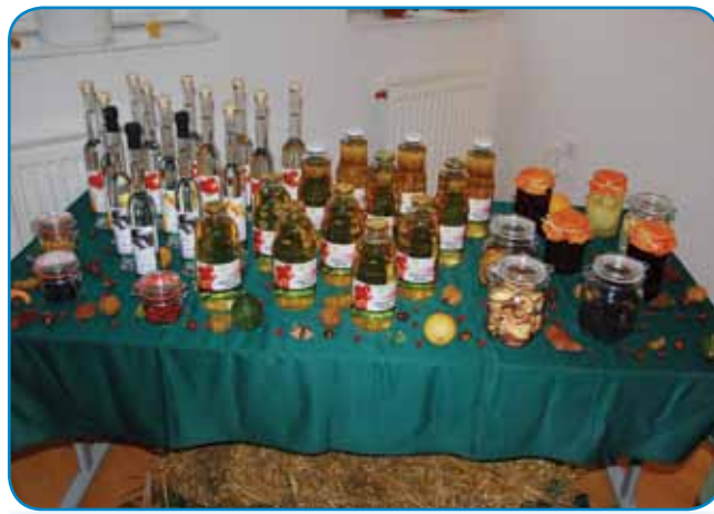
Produkti, ki se bodo lahko prodajali v trgovinci na Vzorčni kmetiji

odločila, da v njem ne bo sodelovala. Čutili smo, da je ta projekt za nadaljnji razvoj Porabja lahko zelo pomemben, zato smo to nalogo tudi z veseljem prevzeli.«