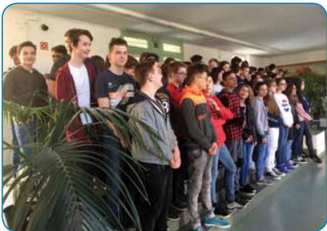
Dijaki Gimnazije Mihály Vörösmartyja so se drugič udeležili Slovenskega dneva