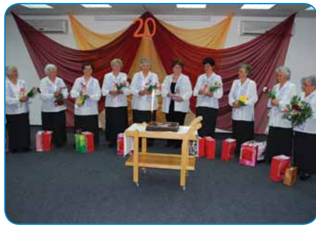
Na 20. jubileji varaški ljudski pevki; Majči neni druga s prave strani

vin tak njali vajo. De pa namé zatok tó bolelo, ka tak moramo njati. Pa ka si moraš, če vidiš, ka ne moreš, pa drudji so ranč tak bili, vsikšoga nika bolelo. Dja sam s srca rada spejvala te lejpe slovenske naute. Zdjaj