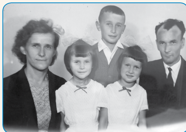
SAMO SEM SPAT ODLA DOMAU stran 8