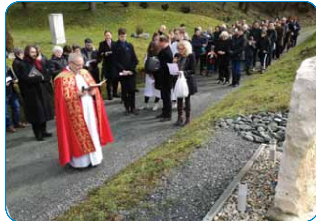
Pri vsaki postaji križevega pota je razmišljal nek vernik

Veliki petek je najbolj tihi dan cerkvenega leta: to je dan Jezusovega trpljenja in smrti na križu. Simbolika velikega petka predstavlja namero in razpoloženje, da se v odpovedi odpremo in postanemo bolj razpoložljivi za Božjo milost in spreobrnjenje srca.