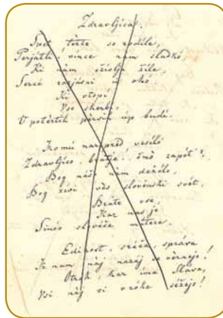
Avstrijska cenzura je nej mogla trpeti »Zdravljico« - nadrukivali so go po revoluciji leta 1848

köszöntő), v prvöj polovici so najbolje važne ideje o bratstvu Slavov, neodvisnosti ino slobaudnosti, štere trbej dosegniti s sodačkimi škermi. Té kitice je cenzura tistoga ipa vöpotegnila, njala pa je drügi tau, šteri se začne z verzi o slovenski mladeničaj pa mladenkaj. V njem je najbolje važna ideja o vküpnom žitki narodov, štero si je za himno vödebro mladi slovenski rosag.