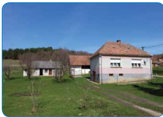
Hiša, v steröj zdaj že sama živi

»Dvatresti lejt sem delala v židanoj fabriki pa te leta 1983 sem v penzijo odišla.«