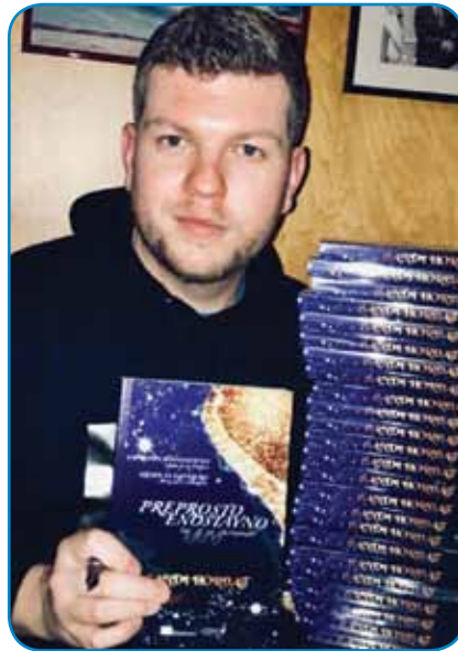
Sandijevo knjigo radi štejo

najst let, stere sam preživo v Kekčevi deželi, je bilou rejsan lepih. Meu sam lepo detinstvo. Po tistom, gda je oča zbetežau za multiplo sklerozy, smo vidli, ka nemo