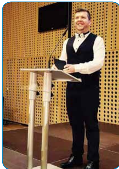
Kak novinar rad guči tüdi pred mikrofonon

več mogli ostati v stanovanji, stero je nej melo lifta. On je čeduže slabše odo. Z bota je prišo na bergle, kesnej v Prekmurji že na voziček in na postelo. In tak smo se preselili v očovo domajo vesnico, Vadarce, gé ške gnesden živem. Tü smo si napravili