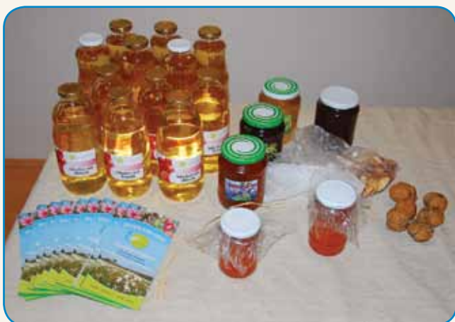
RAZVIJALI BODO ETIČNI TURIZEM stran 4