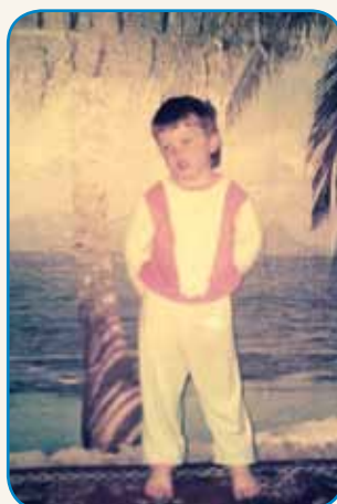
PREPROSTO ENOSTAVNO ČAS... stran 6