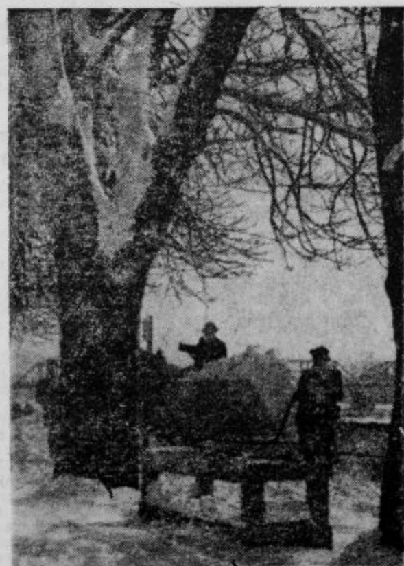
Na obrežju Drave bomo zopet videli voznike pri razkladanju snega mladine v gospodarstvo in o vsem in ledu

Nazivlj temu mednarodna solidarnost v odnosu do Jugoslavije, ki je posem pravilno in človeško reševala begunsko vprašanje, ni bila pravilna in tako smo bili mi precej oskodovali (če ne bodo poravnali stroškov), ker so države, ki so tudi sprejele madžarske begunce, že dobile ustrežajočo odškodnino. Na Jugoslavijo in na njen primer reševanja begunskega vprašanja pa so nekateri gledali nepravilno in nikakor nam niso hoteli priznati naših zaslug. Jugoslavija je izpolnila svoje mednarodne obveznosti in upamo, da bodo tako storili naproti njej tudi ostali.