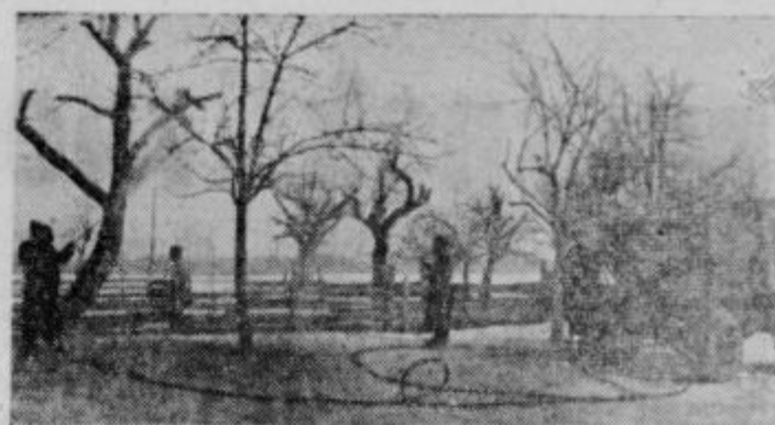
Čiščenje in škropljenje sadnega drevja

Stopamo v obdobje, ko lahko dajemo skupnost čedalje večja sredstva za kmetijstvo. Naša najvažnejša naloga tem letu in naslednjih (in to plan predvideva v občini) bo ureditev socialističnih kmetijskih gospodarstev. Seveda nas pri tem čakajo velike naloge. Gledati moramo realno in prosoditi, s kakšnimi sredstvi so kmetijska gospodarstva začela. Nekatera še danes nimajo gospodarskih središč in stanovanj. Ne moremo mimo rane naših posestev — razdrobljenosti. Naše KZ bodo morale dati iniciativno individualnemu kmetovalcu. Boj za večji in boljji pridelok se mora nenehno nadaljevati. Uspeh pa seveda ne more biti odvisen samo od dobre volje, temveč le od dela.