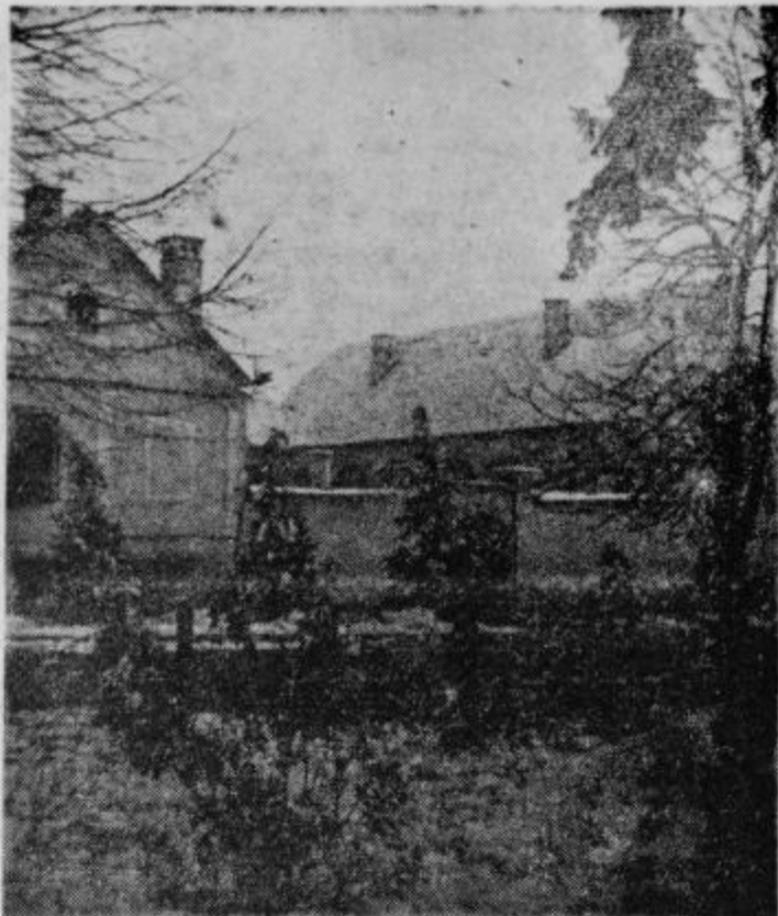
Prizimi v Zavrču

Delegati VI. kongresa LMS v Beogradu in naših občin bodo organizacije SZDL naprosile, da bodo najpomembnejše sklepe kongresa raztolmačili članstvu SZDL, staršem naše mladine, ki bodo tudi v bodoče kot doslej mladino radi podprli pri vsem njenem gospodarskem in vzgojnem delu.