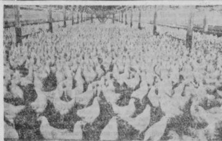
Vzrejališče za pohance