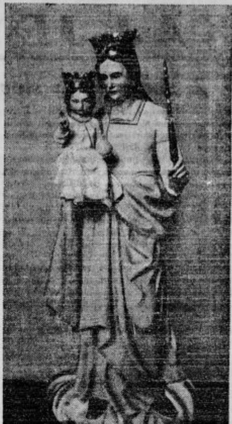
Marija Pomočnica v Pečah. Ta kip je bil slovesno kronan in blagoslovljen v nedeljo, 27. maja in se je na to vršila vprvič v Pečah procesija Marije Pomočnice. Vkljub slabemu vremenu se je zbralo obilno vernega ljudstva tudi od drugod, zlasti iz sosedne Moravske župnije.

Eno kilo težka zrna toče so padala te dni v okolici Neršena v Turčiji.