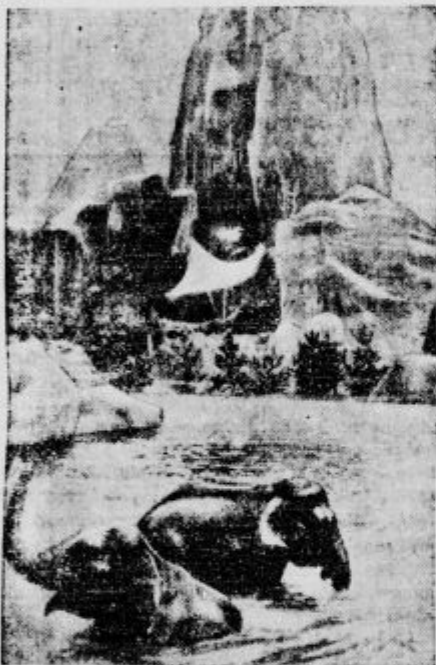
Pariz ima nov zoološki vrt kakor vidimo, je v njem prav dobro preskrbljeno celo za stene, ki potrebujejo zase velikanske prostore.