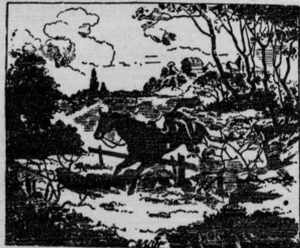
Kje je jezdec?

Irci in Angleži. — »S potapljačje se ladje so se resili na samotni otok le štirje potniki, dva med seboj samnana Irci in dva prav tako Angleža. Irci sta se takoj sprla, strela in eden drugega pobila do smrti. Angleža pa sta se sprehajala po obali in potrpežljivo čakala na tretjega, da bi ju medsebojno predstavil in seznanil.«