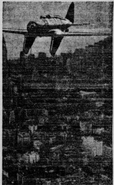
Letalo majorja Severskega leti nad nebotičniki v Newyorku. S tem letalom namerava Severski po- staviti nov rekord na progi London-Avstralija