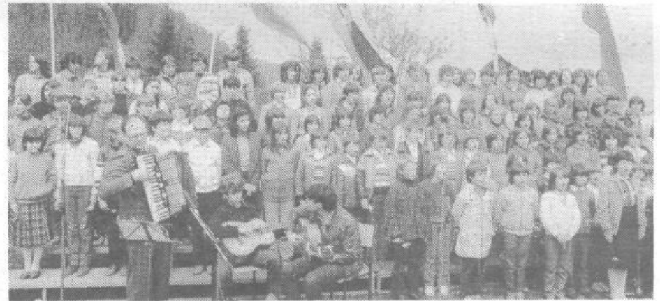
Pesem mladosti, svobode in vznesenosti prežeta z revolucionarnim izročilom je bila ob spremeljavi viške godbe na pihala in v izvedbi šolskih zborov iz OŠ Ljubo Šercer Ig in Oskar Kovačič izpeta udeležencem in prazniku v pozdrav.