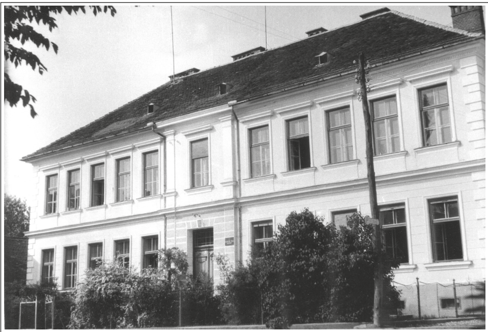
Osnovna šola Miklavž pri Ormožu.

Leta 1829 so postavili novo šolsko poslopje z učilnico in učiteljskim stanovanjem. Po revolucionarnem letu 1848 je vlada določila, da mora začetni pouk potekati v slovenščini. Anton Martin Slomšek je sestavil za štajerske šole dvojezične slovensko-nemške učbenike. Po državnem šolskem zakonu iz leta 1869 je šolstvo prevzela država.