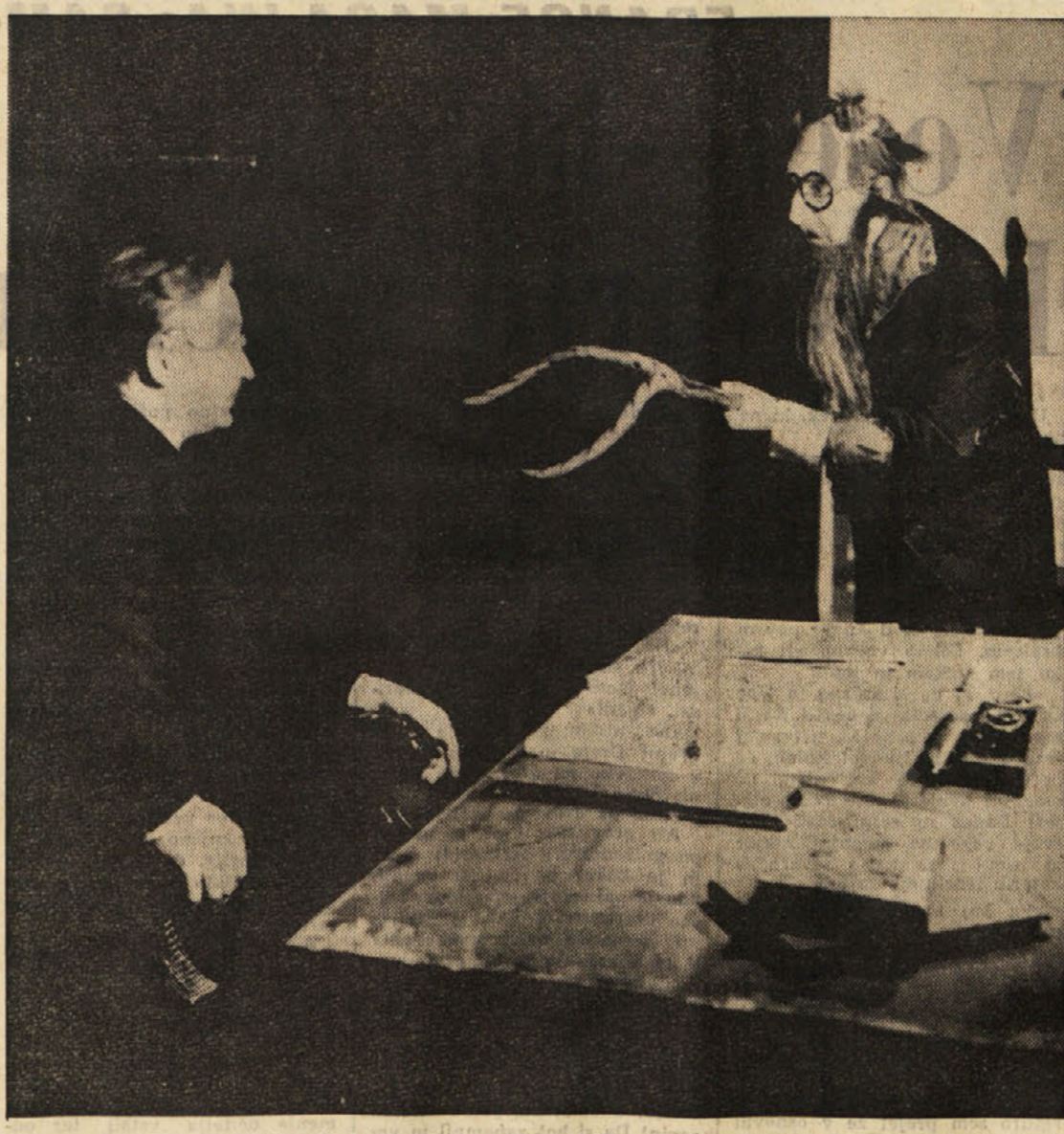
Prizor z večerjajne premiere Pirandellove enodejanke «Patent»