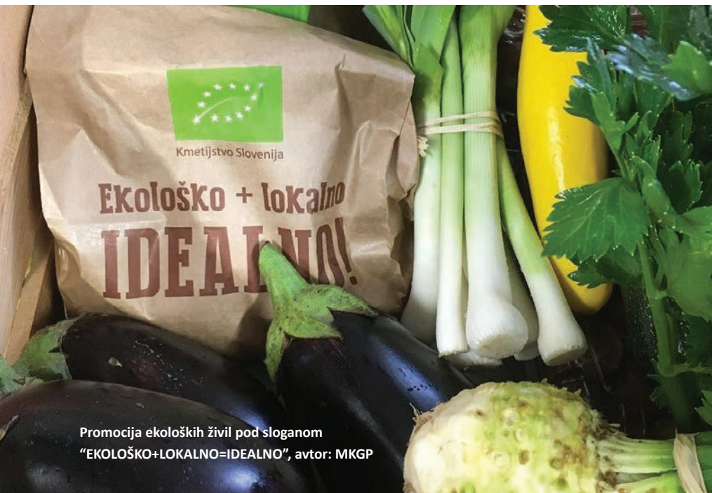
Promocija ekoloških živil pod sloganom "EKOLOŠKO+LOKALNO=IDEALNO", avtor: MKGP