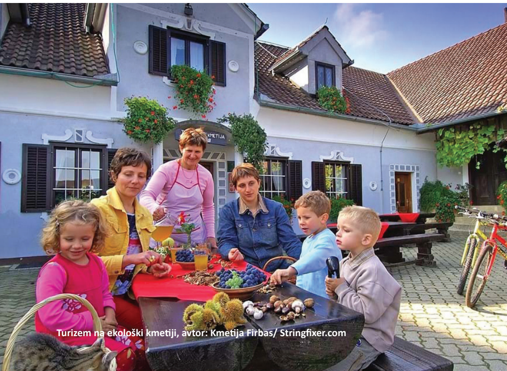
Turizem na ekološki kmetiji

Slovenija se v primerjavi z drugimi članicami EU uvršča med države z najvišjimi podporami za ekološko kmetijstvo, kar je vsekakor pozitivno. Z vidika razvoja ekološkega kmetijstva je problematično to, da lahko konvencionalni kmetje z združevanjem podpor dosegajo podobne ali celo višje zneske kot ekološki kmetje.