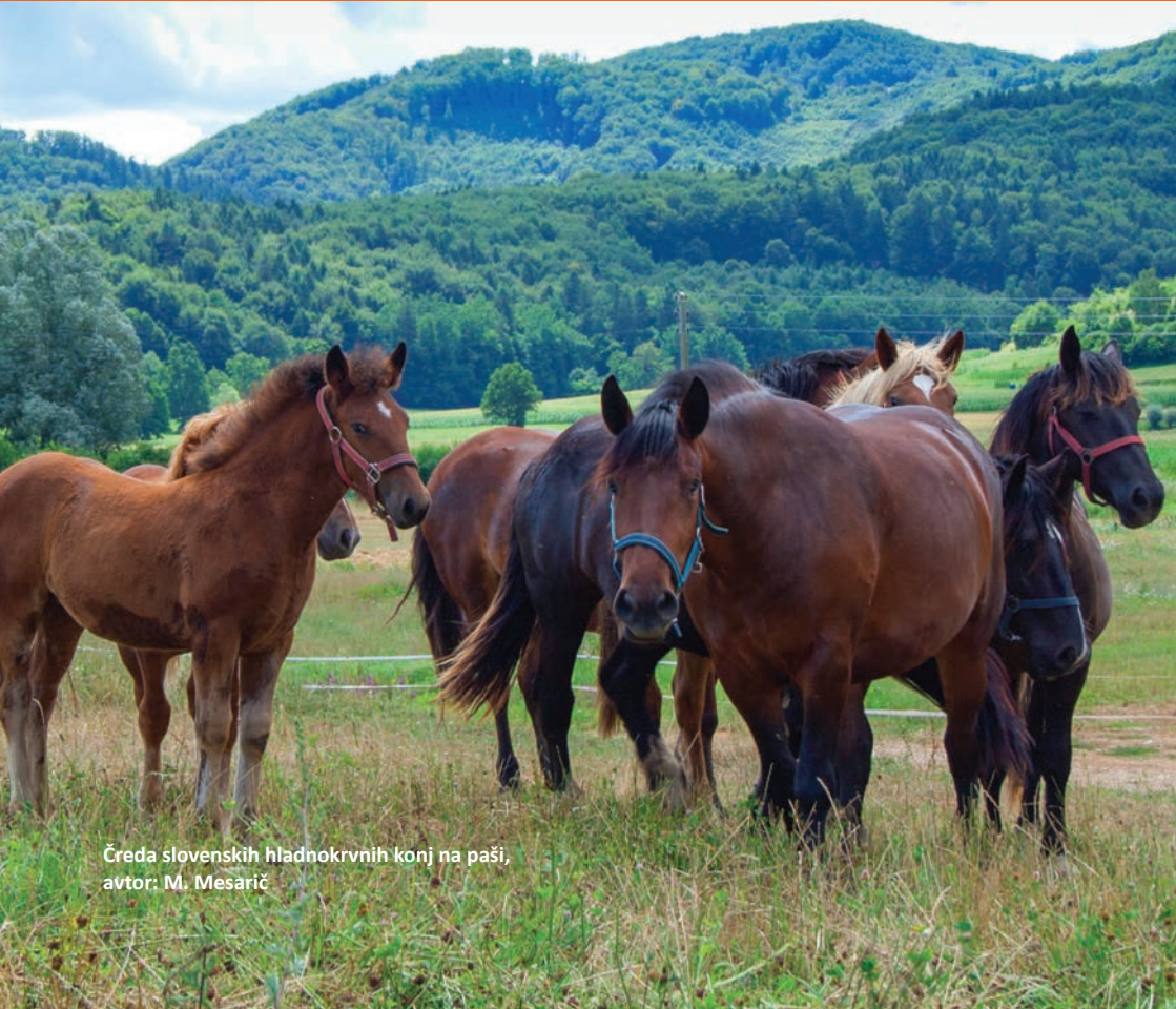
Čreda slovenskih hladnokrvnih konj na paši, avtor: M. Mesarič