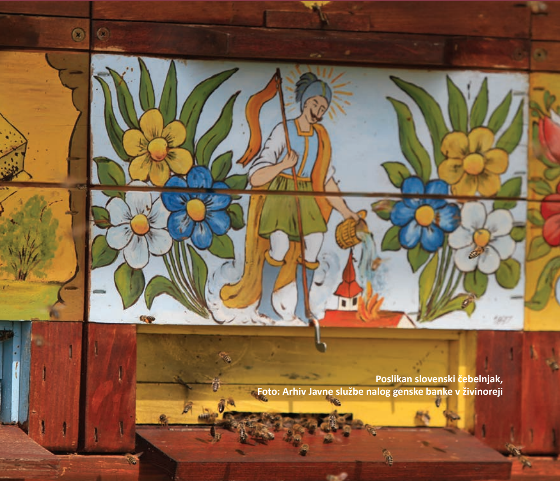
Poslikan slovenski čebelnjak