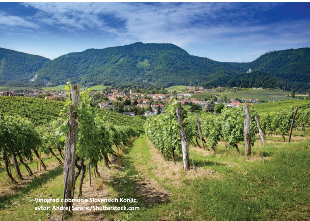
Vinograd z območja Slovenskih Konjic