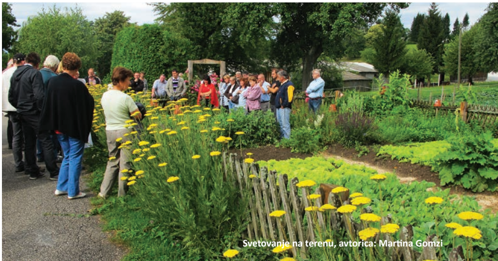
Svetovanje na terenu, avtorica: Martina Gomzi