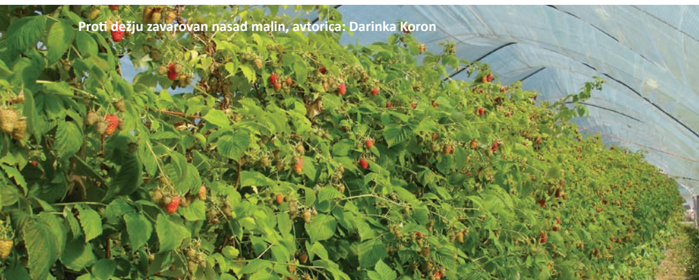
Proti dežju zavarovan nasad malin