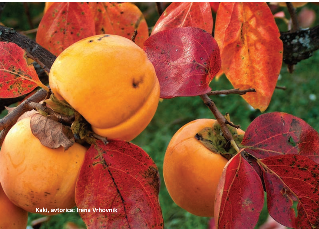
Kaki, avtorica: Irena Vrhovnik