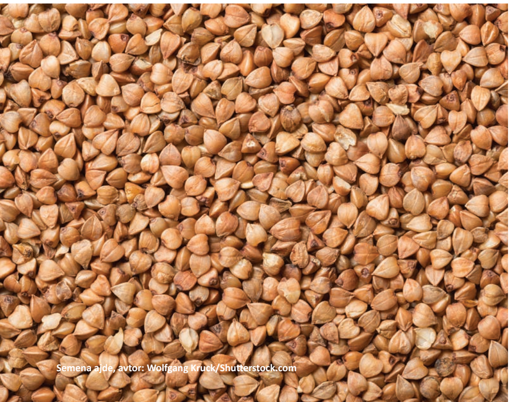
Semena ajde