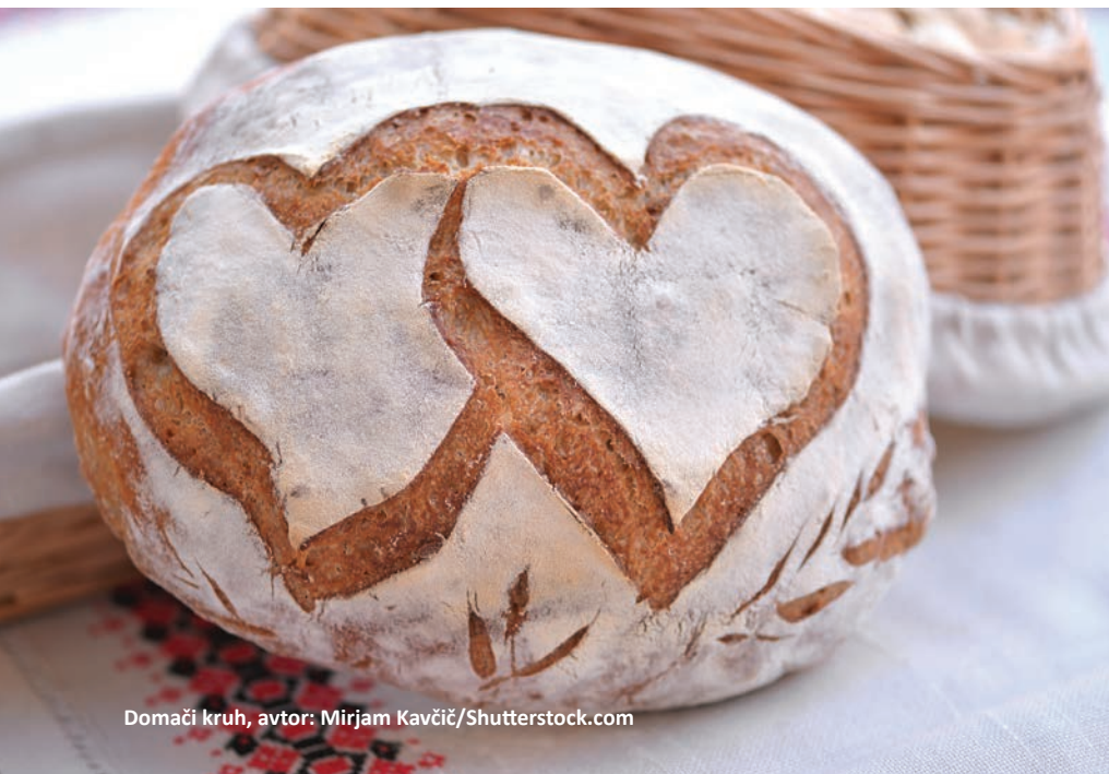
Domači kruh