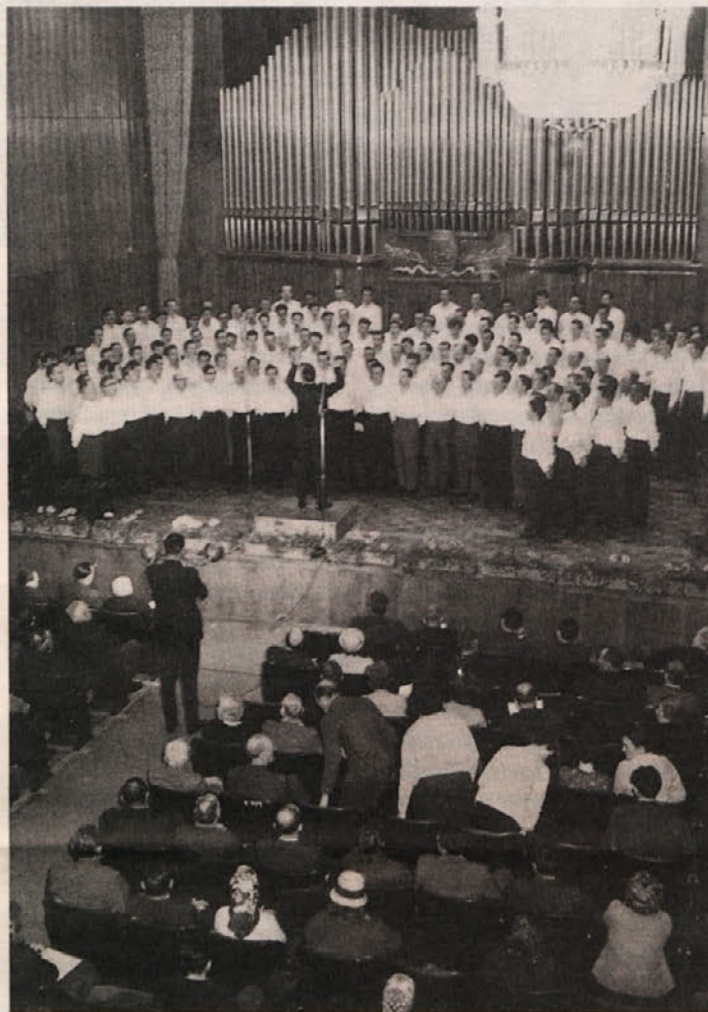
Spominska proslava 14. aprila 1962 v Domu glasbe

Partl je prav zato, ker je minilo 60 let od pregona in naj bi bil čas toliko dozorel, menil, da maša v stolnici naj ne bi bila in ne bo več problem. A kot se zdaj kaže, očitno je.