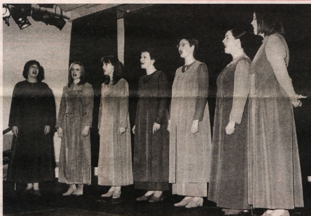
V Šentpetru pri Šentjakobu, v dvorani pri šolskih sestrah in pa v športno-kulturnem centru v Zahomcu so nastopile »KATICE« – ŽENSKI ZBOR IZ SLOVENIJE, ki se je posvetil narodnim pesmim oziroma davnim običajem, ki so deloma še živi med ljudstvom. »Katice« so dekleta, ki za kresno noč, podobno našim kolednikom, hodijo od hiše do hiše in voščijo zdravja in dobro letino. Navdušile pa so predvsem z izredno glasbeno kvaliteto.