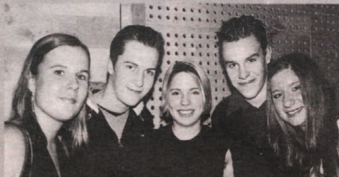
Kmečki ples osvaja tudi srca mladih

Ob zvokih priljubljenega ansambla »Fantje treh dolin« so se plesni gosti odlično zabavali do ranega jutra. M. Š.