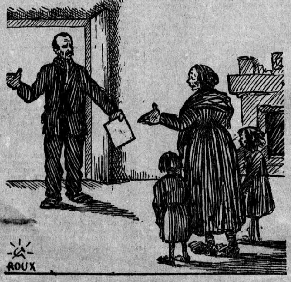
Zena: Še znajliš to ti plačo? Mož: Da. Pa jo ne dobiš ti. Treba jo takoj nesti za fit, ker drugače nas vržejo še z hiše!

Najprej treba znati, da ne smemo zaupati svojemui instinktu gle-