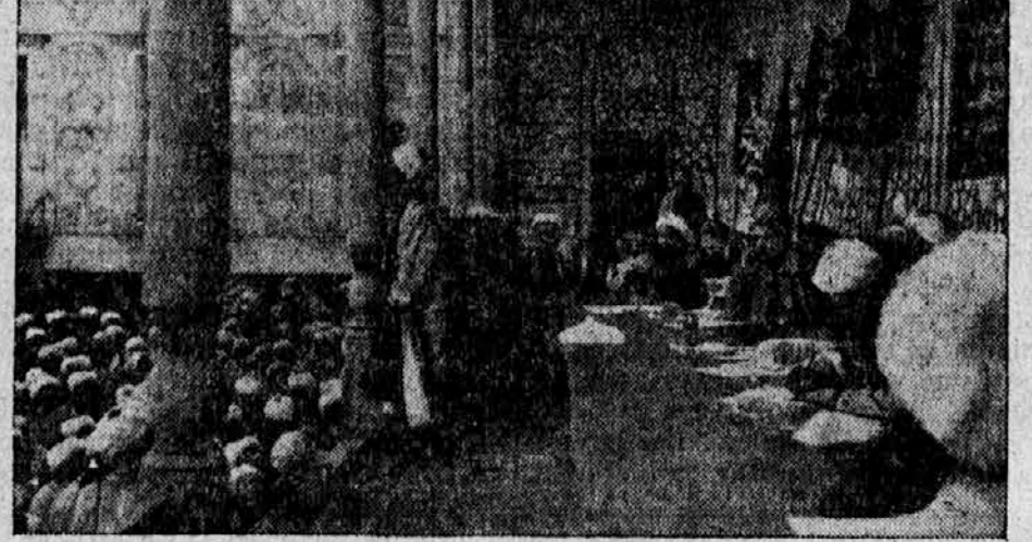
Zbor delegatov sovjetskih republik Kavkaza razpravlja o potrebi vobode dardaneljskih morskih ožin.