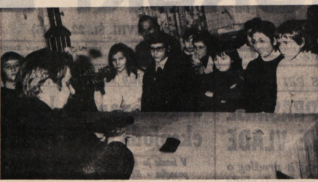
Včeraj so se Škedenjci srečali s pesnikom in pisateljem Cirilom Zlobcem: prosvetno društvo «L. Grbec» je priredilo popoldne srečanje z otroki, zvečer pa literarni večer.