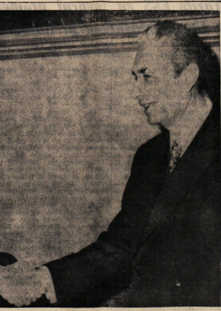
Praga, 26. — Danes se je končalo zasedanje političnega odbora držav članic varšavskega pakta, ki se je pričelo včeraj dopolne...

Sprejeli so tri resolucije: o evropski konferenci, ameriški agresiji v Vietnamu in o sodelovanju med socialističnimi državami