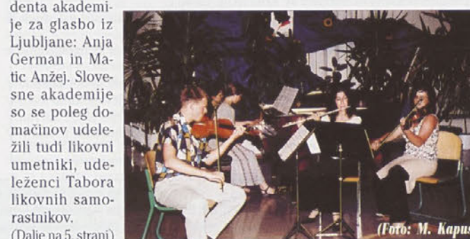
(Dalje na 5. strani)