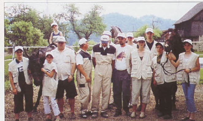
Udeleženci šole jahanja.

Šola jahanja Viktorija ima svoj sedež v Slepšku, v vasi, ki je slaba 2 kilometra oddaljena od Mokronoga. Viktorija so jo poimenovali po prvi kobili z rodovniškim imenom Viktorija Hann, pasme hanoveranec. Šola je bila ustanovljena oz. registrirana oktobra leta 2000. Za opravljanje svoje dejavnosti ima na razpolago 4 jahalne konje in vso potrebno kakovostno