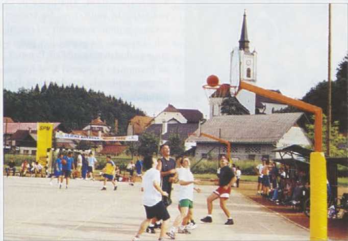
turnir, ulična košarka (na sliki).