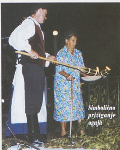
Simbolično prižiganje ognja

In ti verzi naj bodo moto delovanja našega kulturnega društva tudi v prihodnje; morda bo pa še