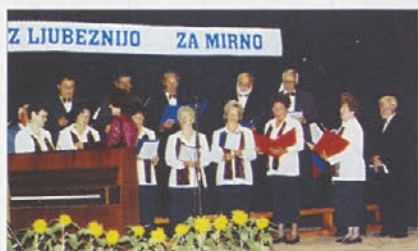
Mešani pevski zbor DU Mirna

Na dan praznika je bila sklicana skupščina daleč najuspešnejšega kluba na Mirni, to je TOM badminton, ki praznuje 10. obletnico ustanovitve, zato so najzaslužnejšim podelili priznanja.