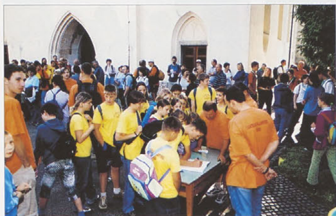
Evidenca pohodnikov pred župnijsko cerkvijo v Trebnjem

V soboto, 29. junija, se je na pohodu po Baragovi poti udeležilo kakih 300 udeležencev. Na srečo se je vreme umirilo in tradicionalna pot je bila prijetna. Kot običajno so pohodnike na poti osvežili z napitki. Razveselj-