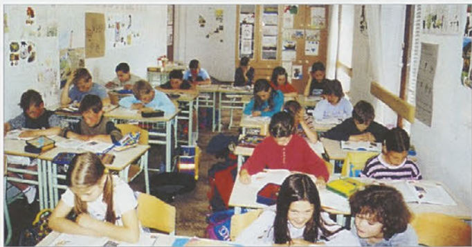
Ena izmed učilnic v Preventovi zgradbi.

valili, ker nam je Prevent omogočil, da imamo pouk lahko kar v njihovi stari zgradbi, potem ko nam je naše učilnice lansko leto popolnoma uni-