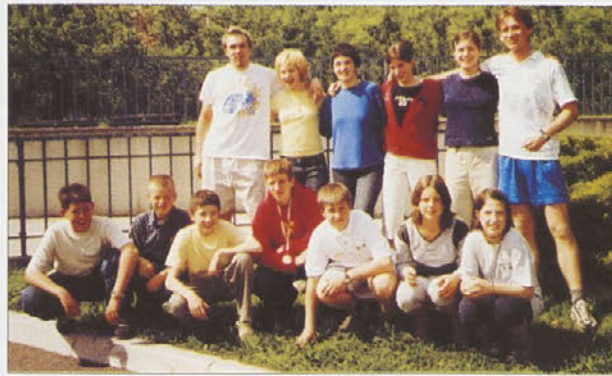
Ekipe BK TOM Mirna na mednarodnem turnirju v Muranu.