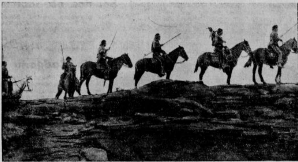
Poglarji zadnjih Sioux-Indijancev, ki žive stisnjeni v majhnih rezervatnih pokrajinah Združenih držav.

Na ladji »Duke« se je kmalu zopet privadil govorjenju. Meseca oktobra 1711 se je izkrcal na Angleškem. Naslednje leto je kapitan Woodes Rogers izdal knjigo o svojem potovanju in tako so postali znani tudi Selkirku doživljaji. Poseben članek je izšel o Selkirku v »Englishmannu«. V Bristolu se je Selkirku baje seznanil z znanim pisateljem Danielom Defcejem, ki je potem leta 1719. izdal svojo knjigo o Robinsonu.