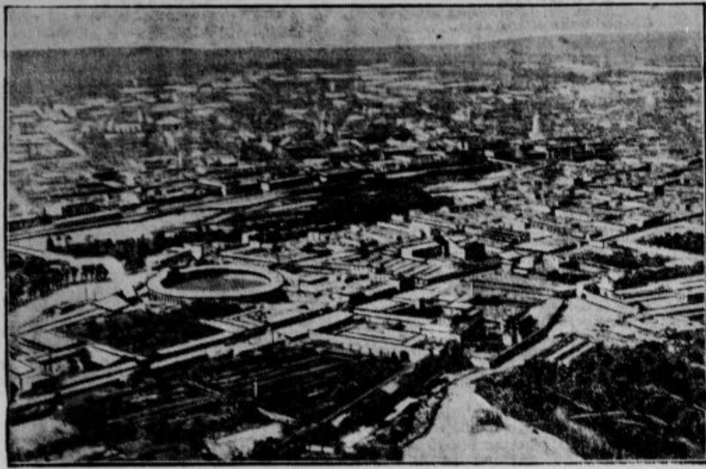
Lima, peruansko glavno mesto, kjer je vlada zaradi delavskih nemirov proglasila obsedno stanje.