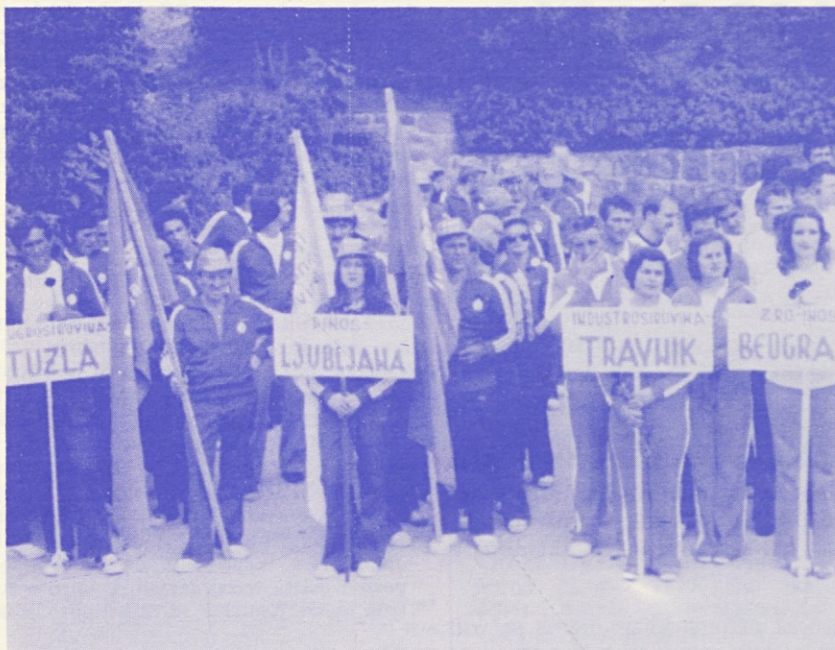
Tekmovalci športnih iger INOT 77 pred spomenikom jugoslovanski vojni mornarici v Podgori.