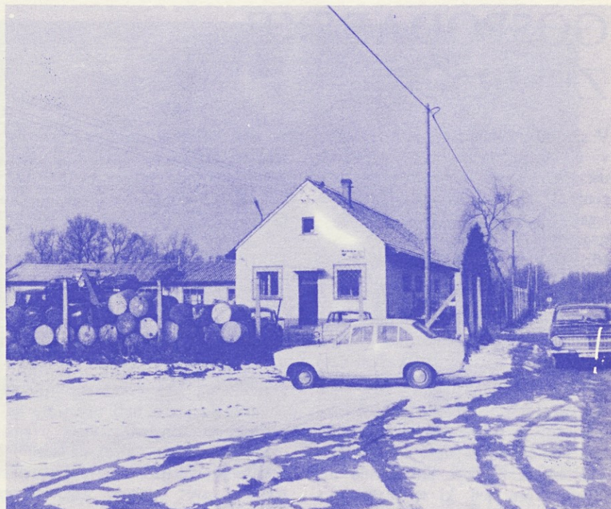
Pri vhodu v naše skladišče v Murski Soboti.