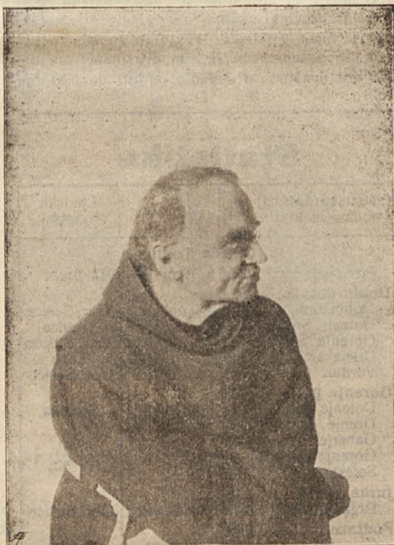
P. Stanislav Škrabec

pisatelj, jezikoslovec in literarni zgodovinar 28. XI. 1831—16. XI. 1887 iz Spod. Retenj pri V. Laščah