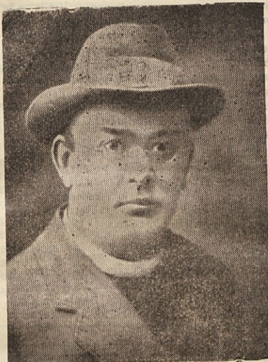
dr. Janez Ev. Krek

kanonik, dež. in drž. poslanec, delegat 15. X. 1841 — 8. VII. 1896 iz Prigorice pri Dolenji vasi