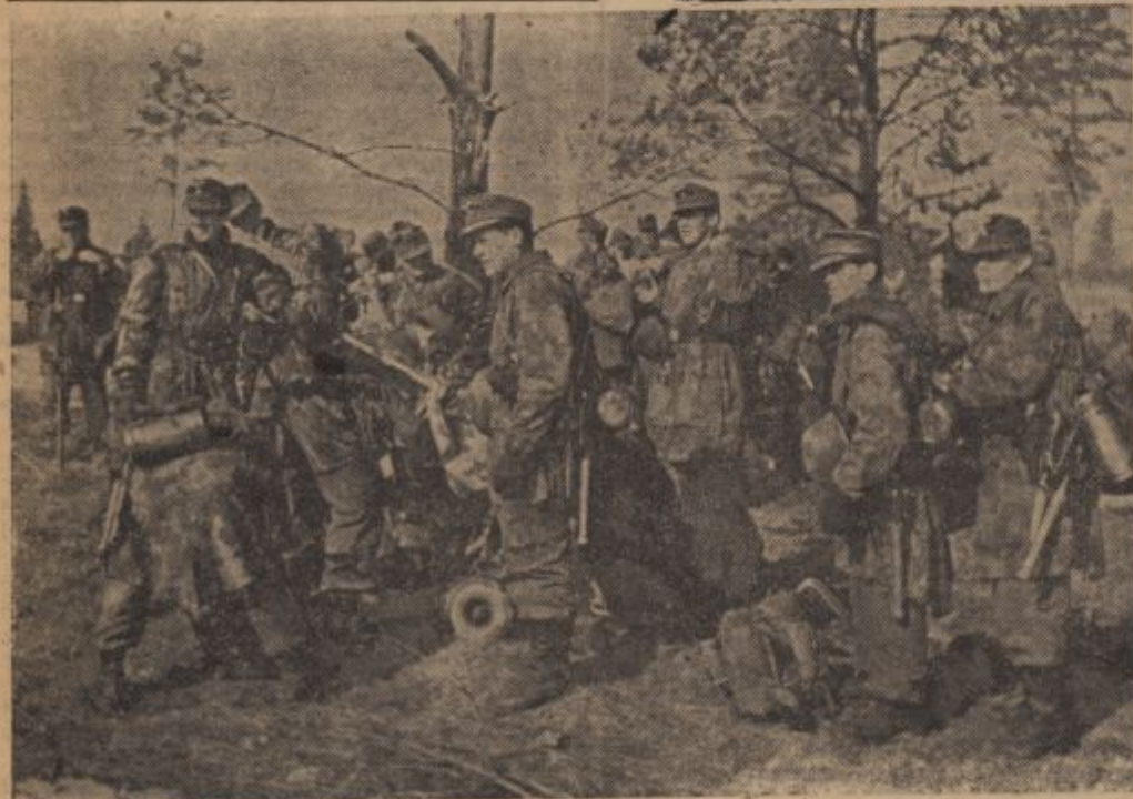
Fallschirmjäger vor dem Einsatz.

Hermann Göring je nekoč iznesel sledeče misli: »Was ist letzten Endes der Nationalsozialismus? Es ist die Lehre vom Glauben, vom Glauben an unser Volk und an seine Zukunft. Dieser Glaube befähigt uns für die Zukunft, das deutsche Fundament so fest zu mauern, daß wirklich und wahr-