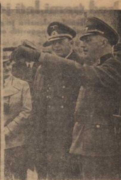
Aufn.: OT-Kriegsber. Weinbach (Wb.)

Der Führer, der seinem alten treuen Mitkämpfer von Herzen kommende Worte des Gedenkens widmete und ihm als viertem Deutschen die höchste Auszeichnung, die Oberste Stufe des Deutschen Ordens, verlieh, grüßt zum letztenmal seinen toten Stabschef.