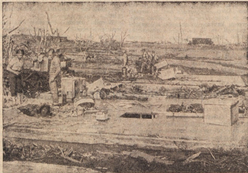
Razne ameriške države so pred nedavnim utrpeli velikansko škodo vsled neurja, ki je zahtevalo tudi veliko število človeških žrtev. Po poročilih znaša število mrtvih več kot sto, medtem ko je število ranjenih še mnogo večje. Tudi materialna škoda je zelo občutna, saj jo cenijo na več milijonov dolarjev. Na sliki vidimo ruševine, ki so edine ostale od ameriškega mesta Udall, kjer je z vso podivjanostjo gospodaril silovit tornado.