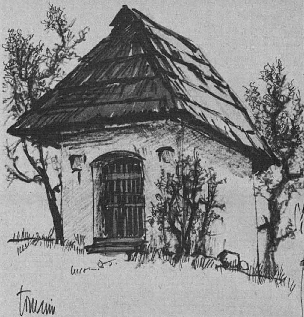
Tone Tomazin: Nekdanji čuvar grunta

— Nevesta? Ne vem. Včasih mi je, kakor da mi bo tudi ona rekla adijo, kakor mi je enkrat že pred tremi leti... In sam ne vem, ali bi mi bilo zaradi tega hudo ali ne... Obsojen sem, kakor sem rekel in vedel že pred šestnajstimi leti. Zato vsem in najbrž tudi Mileni žegen na pot! Vi plešete, jaz pa godem na harmoniko. Taka je usoda nesrečnih godcev, pa naj jih še tako srbe podplati, da bi zaplesali sami. Stara se ob igranju viž, siromak plesaželjni, pa ve, da ne bo plesal, marveč igral, igral, dokler ne bo omagal po kaki veselici, ki je bila veselica le za druge, življenje le za druge, a zanj delo, samo naporno delo, delo do smrti. A jaz, jaz bom služil, služil besedi... Sicer pa, kaj bi govoril o tem. Vsakomur je usoda že v zibko položena in jo mora živeti, kakor mu je bila namenjena... No, da, kaj bi tožil... Sprejel sem breme na svoja pleča. Misli in ideje me ne izpuste iz rok in načrtov je v meni kljub mojemu lamentiranju še vedno toliko, da bi jih lahko uresničil vse komaj v sto letih. Ideje mi