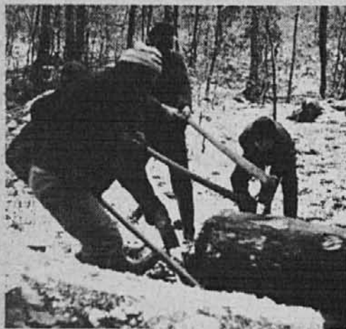
Medsebojna pomoč pri spravljanju hlovdovine

v Studorju v večji meri, kot v drugih agrarnih naseljih prisotna tradicionalna in komformistična miselnost. Že po nekaj dneh pa sem morala korenito spremeniti svoje mišljenje.