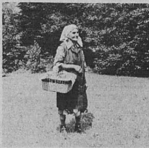
77-letna Udolnjekova mama nese hrano »južno« na rovt Lazi

Mimo pripraganja pa se v zadnjih letih, ko so začeli prihajati v vas prvi traktorji, vedno bolj uveljavlja menjavanje vprežnih in strojnih uslug med lastniki traktorjev oziroma vprežne živine. Povsem nove oblike sodelovanj zaradi inovacij v kmetijstvu, ki pa bodo v prihodnjih letih, ko bo še naraščalo pomanjkanje delovne sile, nedvomno dobivale tudi še nove dimenzije.