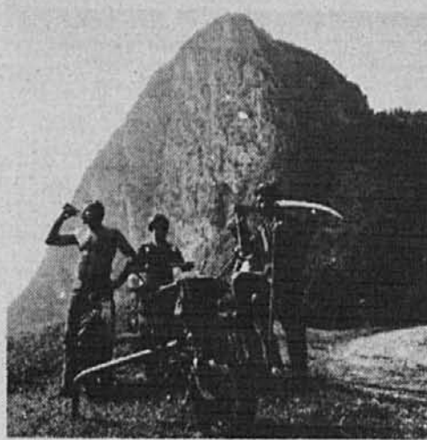
Ušinov kosi Udolnjekovim – malica po končanem delu

In tudi med ličkanjem, kot pri ostalih delih med premorom, so se največkrat pogovarjali, kot zatrjujejo, o gopodarskih zadevah, kot pa da bi zbijali šale na račun vaščanov in prebivalcev sosednjih vasi ter obirali ljudi, kar je pri ličkanju sicer precej splošno v navadi.