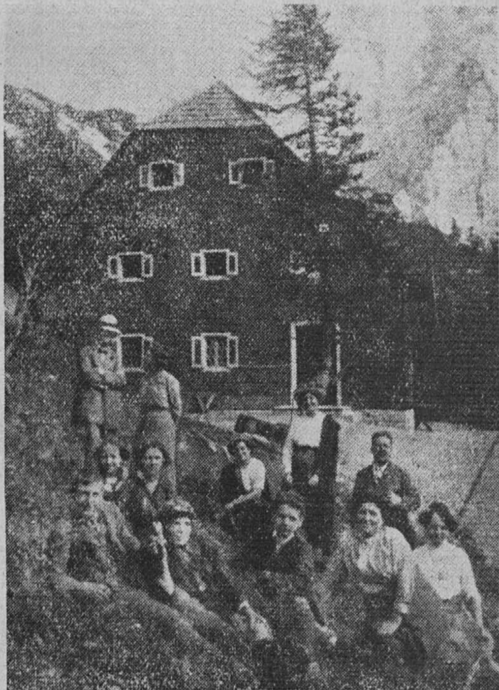
Ivan Cankar (v belem klobuku) na Vršiču

(41) I. Cankar, Zbrano delo. XXIX. knjiga, str. 515. DZS. Lj. 1974.