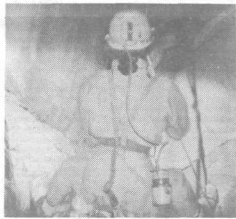
Jamarka v breznu

poleg ostalih kapniških tvorb tudi precej heliktitov, zelo zanimivih kapnikov.