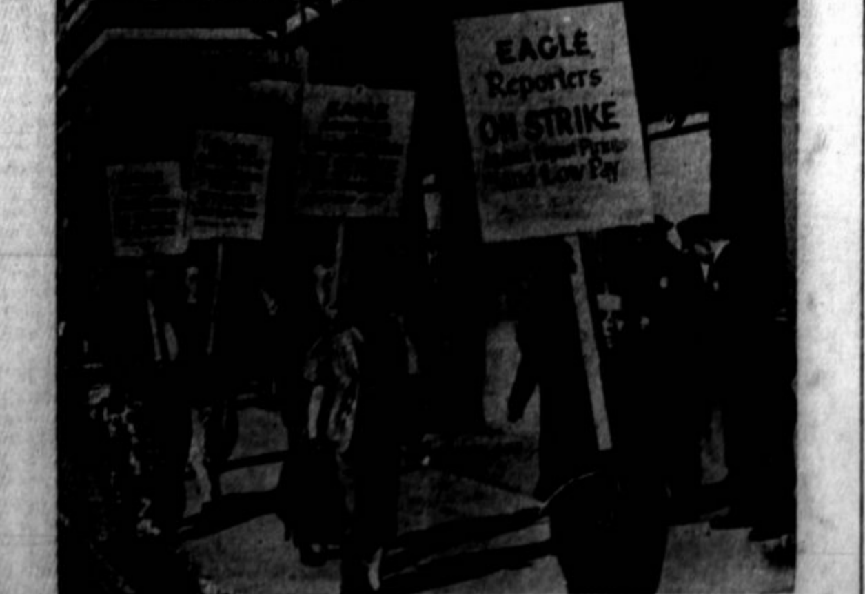
Časnikarji, člani Ameriškega časopisnega gilda, piketirajo urad lista Daily Eagle v New Yorku po oklicu stavke.

San Francisco, Cal. — Delavske organizacije in svet stavbnih unij so ustanovile posebni odbor, ki bo vodil boj proti ponovnemu uveljavljanju odredbe proti piketiranju. Nova odredba je bolj drastična nego ona, ki je bila preklicana v zadnjem novembru.