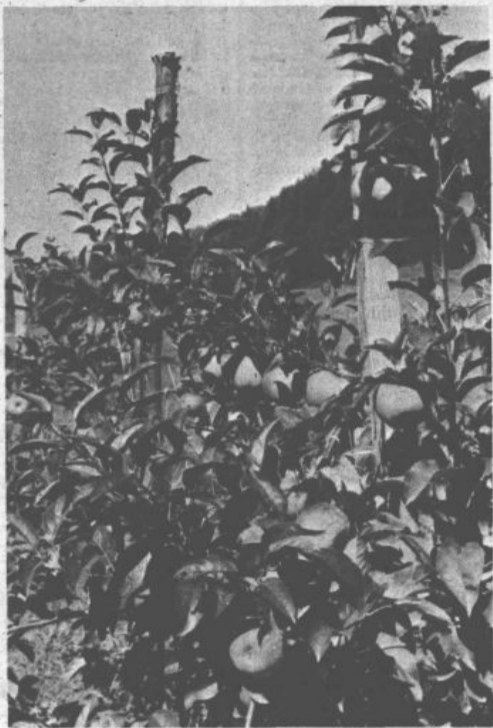
Triletni nasad na Turnu lepo kaže

Sicer pa jabolka s Turna in ob Rdeči dvorani romajo vsako leto istim kupcem, ki so s kvaliteto in rokom dobave zadovoljni. Zapišimo še, da bodo v pomoč pri obiranju poznih vrst jabolk tudi letos sezonski obiralci in domači,