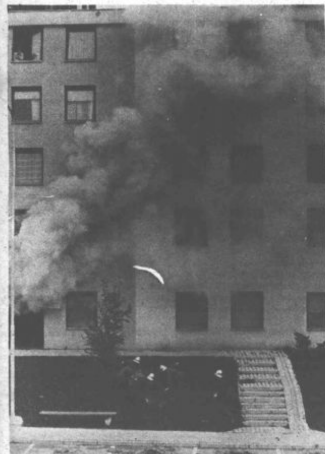
Primerov, ko je zagorelo v stanovanjskih hišah in je ogenj napravil neprecenljivo škodo, je bilo v Titovem Velenju doslej že precej

V zadnjem času beležimo vse več elementarnih nezd, ki povzročajo družbi in posameznikom vsako leto nepopravljivo gmotno in materialno škodo. Zlasti požarov zaradi strele, samovžiga, napak na električni napeljavi, malomarnosti in drugih vzrokov je v letošnjem letu precej več, kot v preteklosti. Drugih nesreč, katerih posledice so prav tako zaskrbljujoče, seveda ni treba posebej omenjati. Seveda se proti tem nevarnostim borimo z vsemi sredstvi, žal pa smo velikokrat nemočni in posledice so tu.