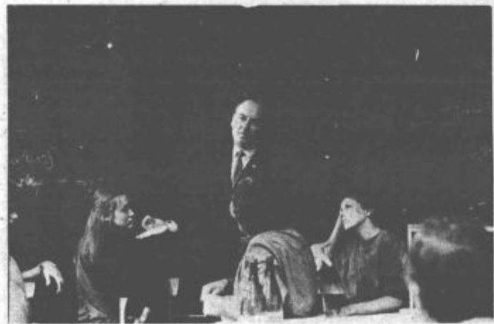
Prizor iz igre