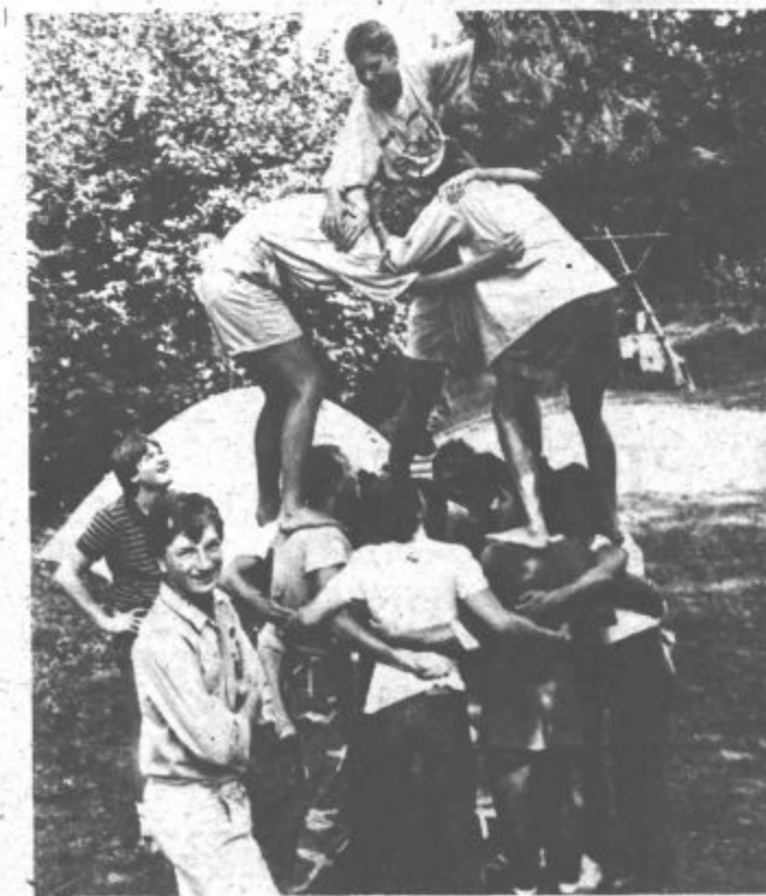
Družabna srečanja so bila polna domislje

Objekt naj bi predali svojemu namenu v letošnjem tednu otroka, prvi eden meseca oktobra, še prej pa mora izvajalec del, velenjsko gradbeno podjetje Veograd, odpraviti nekatere pomanjkljivosti za pridobitev uporabnega dovoljenja.