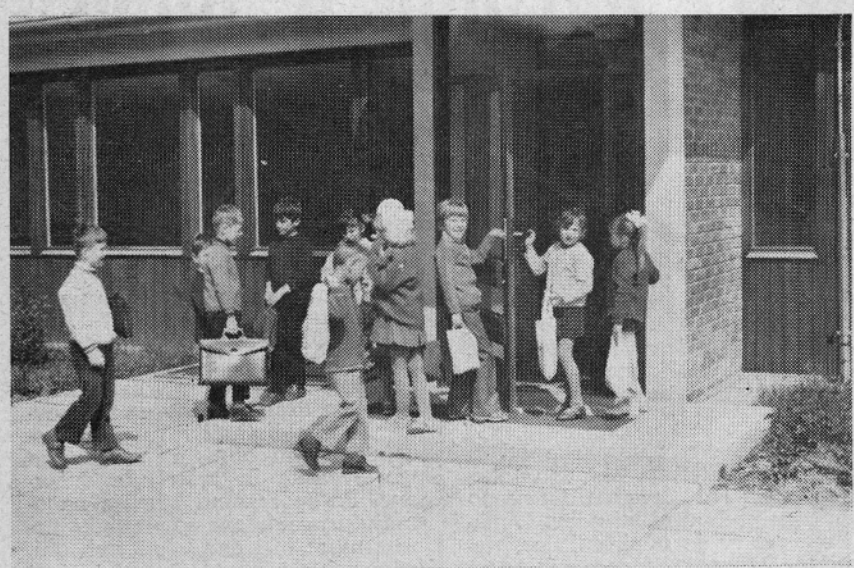
Konec brezskrbnosti. Pričela se je mala šola. Pred njimi so že prve naloge. Z vsakim dnem jih bo nekaj več, pričeli so se učiti, da jih bodo lahko uspešno izpolnjevali, tudi tiste najodgovornejše