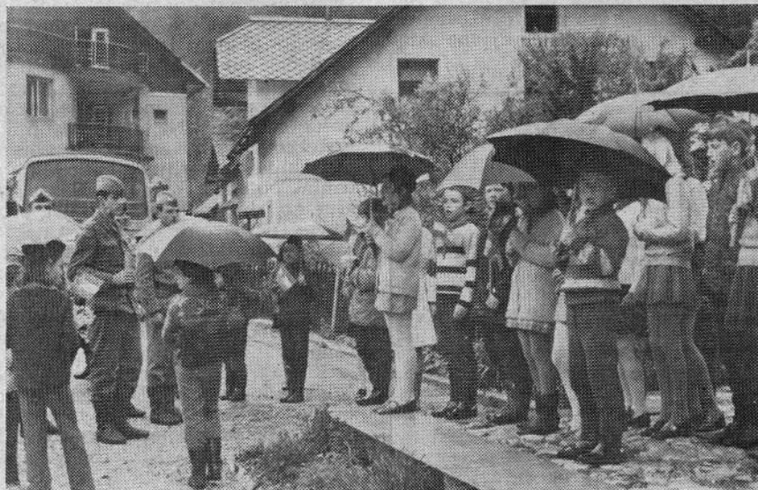
Pionirji iz Solčave so sprejeli štafetno palico iz rok graničarjev in jo ponesli proti Lučam