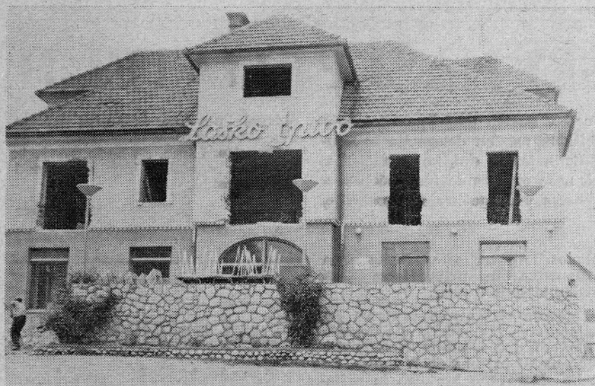
Gradbena dela pri razširjanju nočitvenih kapacitet v »PLANINKI« potekajo hitro, kar je nedvomno tudi potrebno, saj se bliža čas, ko bo potrebno sprejeti nove turiste

jo tudi v poslovanju delovnih organizacij v občini Mozirje. Neuravnotežena dogajanja v proizvodnem in menjalnem procesu povzročajo kopico neskladij, kar otežkoča smotrno upravljanje in vodenje poslovne politike v posameznih gospodarskih enotah. Odsev tega je netržno obnašanje proizvajalcev in tudi potrošnikov, kar povzroča, da delitev ustvarjenih dobrin ni skladna z vloženim delom, zato so bili podzvzeti ukrepi za postopno umirjenje gospodarskih gibanj. Učinki stabilizacijskih ukrepov so prišli do večjega izraza šele v drugi polovici leta, ki se kažejo predvsem v ugodnejši delitvi družbenega proizvoda v prid gospodarstva, v počasnejši rasti proračunske potrošnje in investicijske porabe za osnovna sredstva. Še vedno pa so prekomerno naraščale cene, saj so se le-te na drobno povečale v lanskem letu za 14,30 odstotkov.