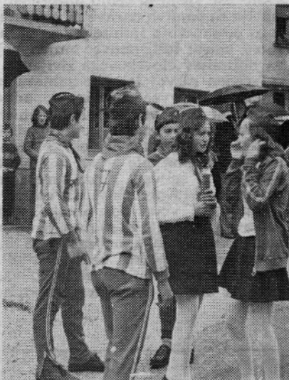
Pionirji iz Luč

delček vsakega, v vsem je droben glasek — srečno, tovariš Tito! In povej mu — štafeta mladosti — da smo njegovi in da vemo, da je naša prva dolžnost — učiti se.