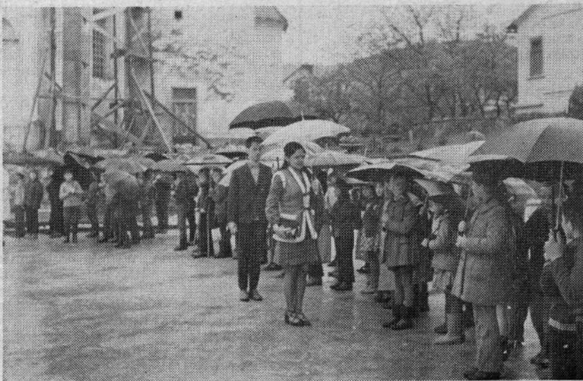
Tudi v Rečici ob Savinji nas je spremljal dež

A štafeta mladosti mora dalje. Na Rečici jo čaka še toliko mladih src. Nihče se ne meni za dež, ki kaplja po čelu, samo da je pri nas štafeta mladosti. Ukradimo jo za trenutek in naj bo čisto čisto naša, da bomo vanjo povedali, kako smo bili zadihani, ko smo jo nosili in kako lepo je sijalo sonce, ko smo hiteli z njo. Ne, dež takrat za nas ni padal.