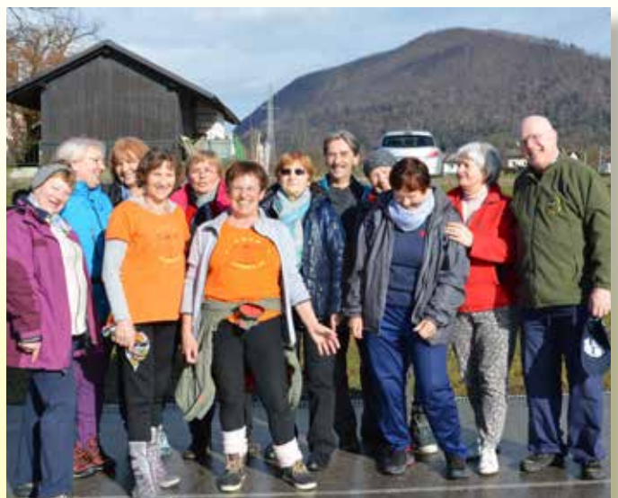
Po prvi vadbi na gregorjevo