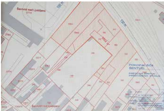
Idejni osnutek širitve žarnega pokopališča ob sedanjem pokopališču v Šentvidu

Tudi pozneje na skupnem sestanku s CI v sejni dvorani na MOL 20. 4. 2017 je župan ponovil: »Šentvidčani, dobili boste širitev pokopališča.« MOL je v aprilu 2017 v ta namen poslala tudi vlogo št. 3504-214/2010-36 MD na Ministrstvo za okolje in prostor oziroma pobudo za spremembo uredbe iz leta 2004, ki je bila pozneje tudi modificirana v drugih dokumentih (Uradni list RS št. 43/15, ki v 29. členu prepoveduje gradnjo in širitev pokopališč v Šentvidu, Dravljah in Stožicah). MOL si prizadeva, da bi bila njena pobuda za spremembo uredbe na vladi čim prej sprejeta in s tem omogočena širitev žarnega pokopališča v Šentvidu in na ostalih dveh pokopališčih.