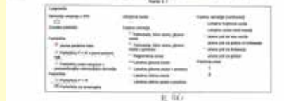
Veljaven OPPN za P&R, ki v točki 6.5 določuje izvedbo P&R

Ostaja neka bojazen, da bo tu v Guncelj predelava in sežiganje komunalnih odpadkov, a mislim, da je ta bojazen odveč. MOL v tem delu Guncelj nima izdelane do sedaj nobene študije ali veljavnega OPPN. Edino veljaven OPPN je priložen zgoraj. Ta P&R bi bil že zdavnaj realiziran, če bi država izvedla štiripasovno cesto vsaj do priključka za Stanežiče.