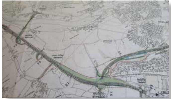
Del prostorskega načrta veljavne uredbe, od križišča Metalke do Medna

Za celovito ureditev prometa in odpravo zastojev v naši ČS je bila v letu 2011 sprejeta uredba o državnem prostorskem načrtu za navezovalno cesto Jecra-Stanežiče-Brod (Ur. l. RS, št. 10/2011).