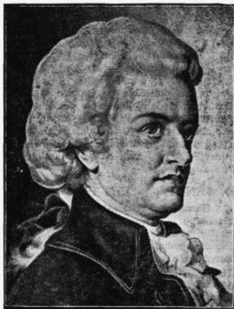
W. R. Mozart, čigar skladbe bo izvajal Radijski orkester v petek ob 20.30.

Ceravno priredi italijanska radiouprava vsako jesen svojo posebno razstavo, je tudi razstava radioaparator, ki se vrši na velesejmu prav tako pomembna kakor jesenska razstava industrijskih proizvodov. Glavni predmet zanimanja na tej izložbi je gotovo radijski sprejemni aparat, ki je navadno troceven, tkzv. Radio Balilla in med narodom tudi najbolj razširjen. Med aparati, ki so bili razstavljeni v prejšnjih letih je bilo malo takih, ki bi imeli vdelano tudi pripravo za igranje plošč; sedaj pa je opaziti, da je tovrstnih aparatov vedno več in celo presežejo število onih aparatov, ki te priprave nimajo. Kakor je videti, gre tudi italijanski radio po dobro začrtani poti napredka in uspeha, ki je zlasti viden tudi v tem, da oddaja italijanski radio več programov v inozemstvo, kot jih pa od nje sprejema.