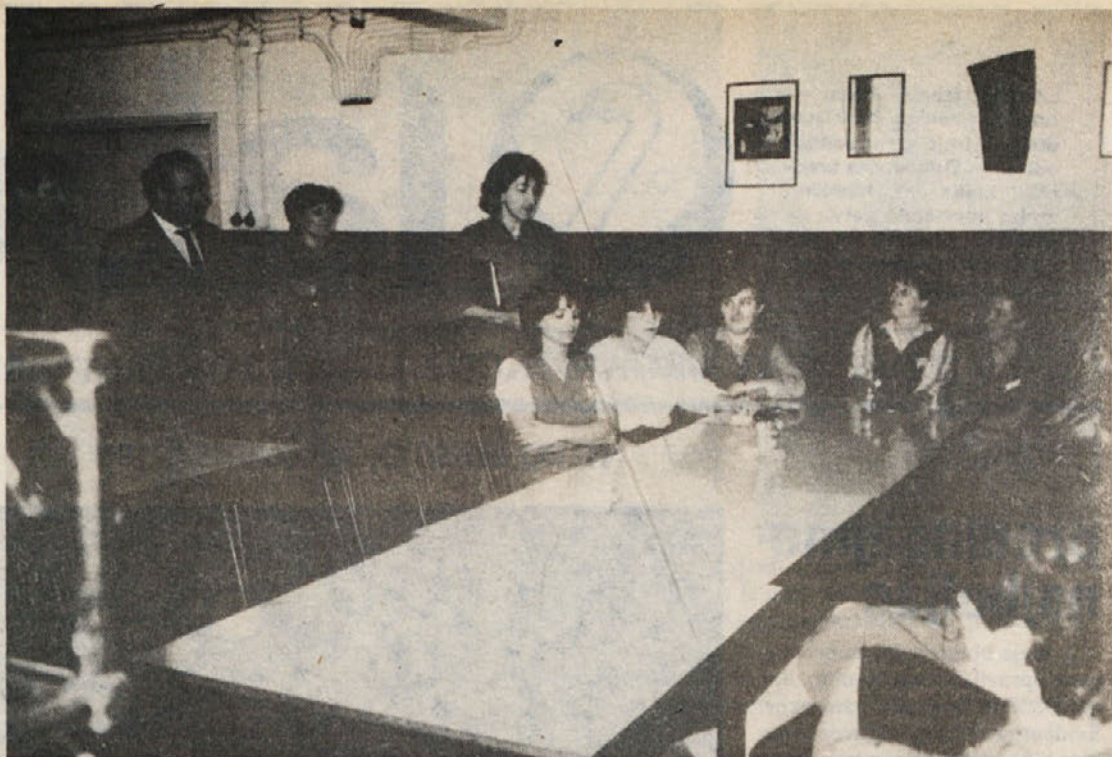
Prvo srečanje predstavnikov šol in naše delovne organizacije z bodočimi učenkami v Zali.