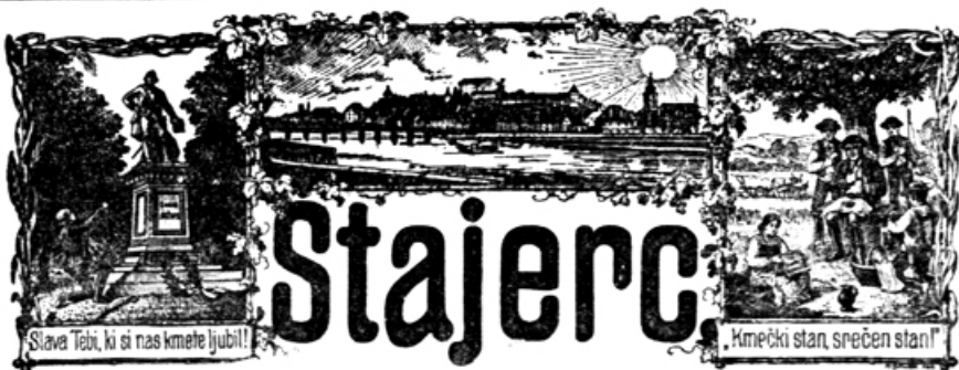
Slava! Tebi, ki si nas kmete ljubil!

Uredništvo in upravništvo se nahajata v Ptuj, gledališko poslovanje ter 3