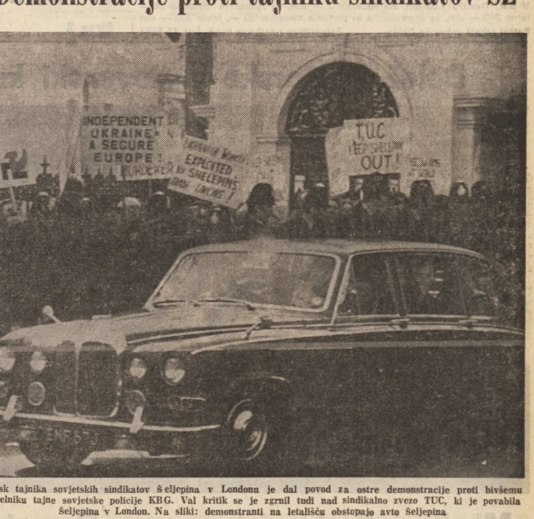
Obisk tajnika sovjetskih sindikatov Šeljepina v Londonu je dal povod za ostre demonstracije proti bivšemu načelniku tajne sovjetske policije KGB. Val kritik se je zgrnil tudi nad sindikalno zvezo TUC, ki je povabila Šeljepina v London. Na sliki: demonstranti na letališču obstajajo avto Šeljepina