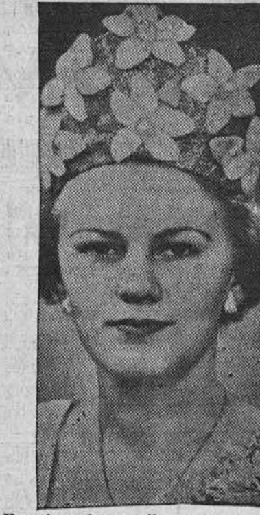
Ena izmed mnogih ameriških "kraljic". To le so si izbrali na neki pomladanski prireditvi.