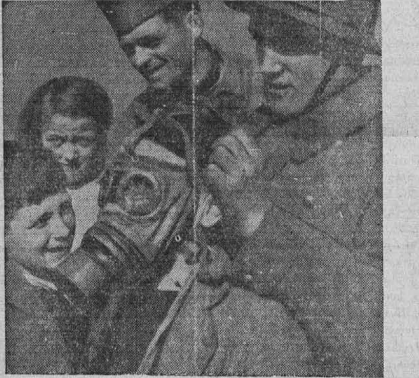
Francoski vojaki poučujejo v obmejnih krajih šolske otroke v rabi protiplinskih mask. Ali jih bodo kmalu potrebovali?