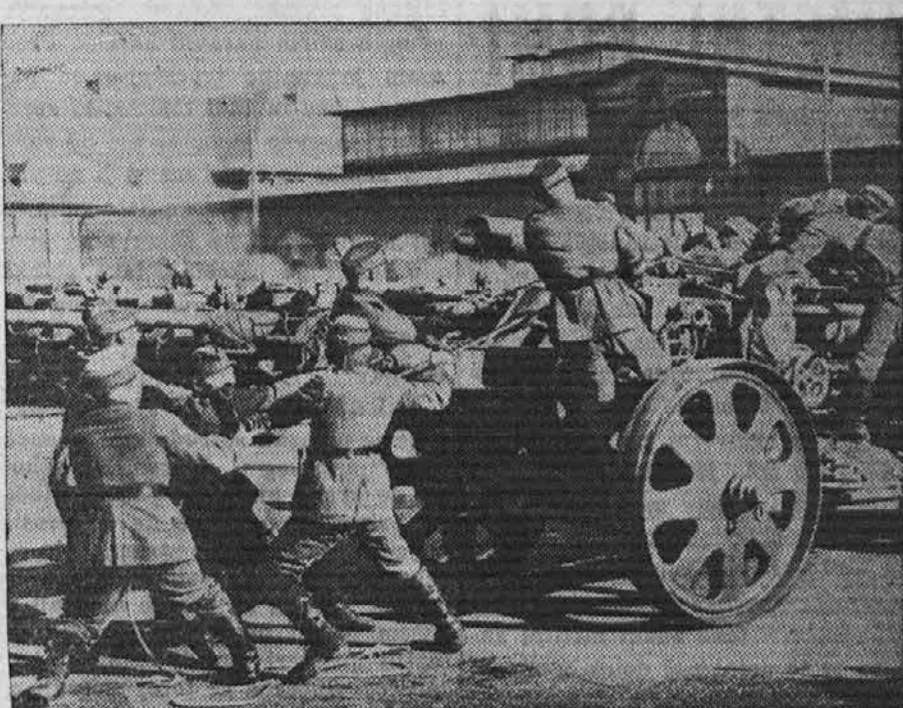
Nemcem se mudi: Celo ponoči so spravljali težke topove v Koeln, ob francoski meji.