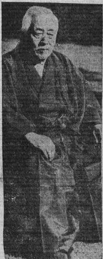
Makoto Saito, bivši japonski predsednik, ki je bil tekom zadnjega upora v Tokiju, proglašen za umorjenega

Veliko posojilo namerava najeti abesinska vlada na Angleškem. Pogajanja so baje že dobro napredovala in dobe Etiopci denar, ki ga nujno rabijo za vojni material. Če je to res, pomeni pač, da Angleži se niso popolnoma prepričani o končni zmagi Italijanov.