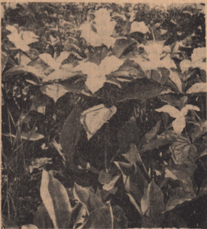
Trillium—ontarijska cvetica, ki pokriva mnoge predele v Ontariju, kot narcisi pri na Golico. "C.S."

PROSIMO, PORAVNAJTE NAROČNINO IN DARUJTE V TISKOVI SKLAD "SLOVENSKE DRŽAVE"