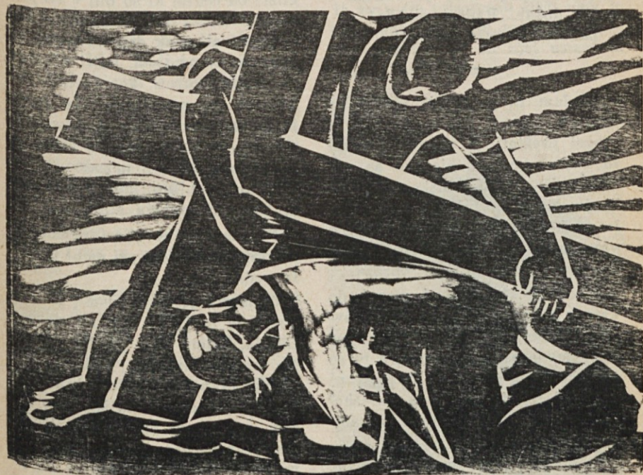
Jezus pade pod težo križa (Lesorez, ak. slikar Ivan Bukovec)

Jezus umira na križu... Strašna je Njegova smrt, mi pa drhtimo pred vsakim najmanjšim trpljenjem. Delo nas teži, v težavah godrnjamo, vse in vselej nam je pretežko. Kako se bomo kdaj dvignili iz nizkosti kvišku, če ne vi-