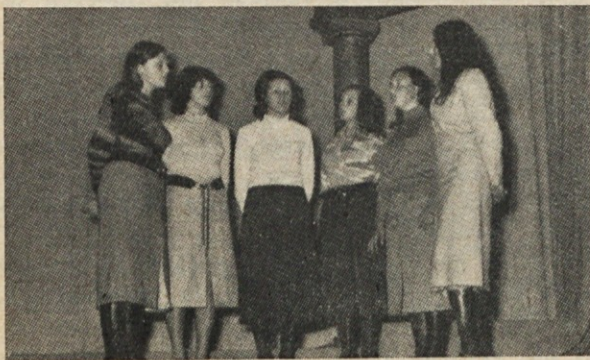
Dekliški sekstet iz San Justa na glasbenem festivalu

Komaj je stopila nekaj korakov, se je presenečena ustavila.