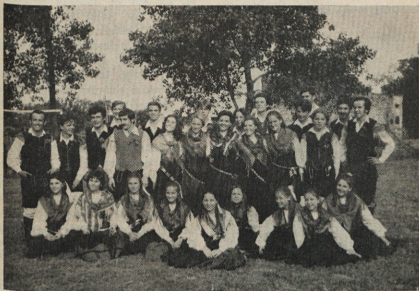
Skupina deklet in fantov iz Castelarja — Veliki Buenos Aires — v narodnih nošah

Vsak narod pod nebom je dobil od Stvarnika lastne darove in prednosti, naj je velik ali maj-