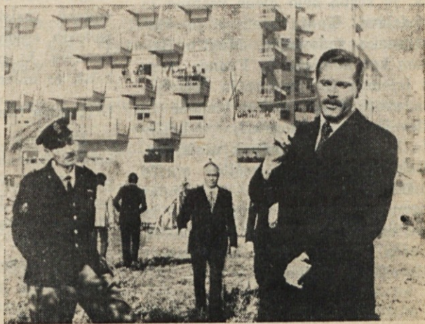
Martin Balsam (v sredi in Franco Nero (desno) v vlogi komisarja in sodnika

Gledalec spremlja z razumevanjem in simpatijo razvoj komisarja, ki ga značajna nepotrpežljivost, moralna utrujenost in usmiljenje do žrtev, ki jih je poznal od blizu, nujajo k sklepu, da bo vršil pravico mimo legalne pra-