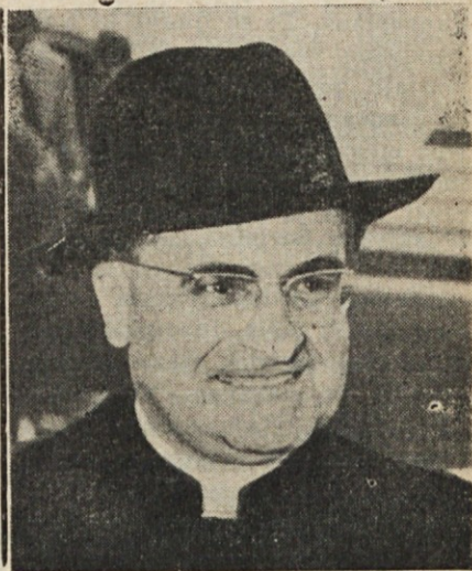
Kardinal Julius Döpfner, predsednik nemških škofovskih konferenc

Nemški škofje obžalujejo, da se o tem zlu, ki je v današnji družbi, premalo govori. Pred tako stvarnostjo nima nihče pravice zapirati oči.