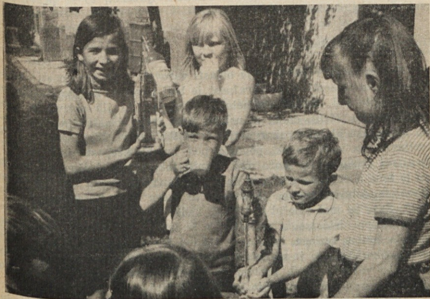
Žejo si gasijo na Pristavi v Castelarju pri Buenos Airesu

Iz tega načelnega spoznanja sledijo nekateri zaključki in namigi, kako naj mož v zakonu izvršuje svojo avtoriteto.