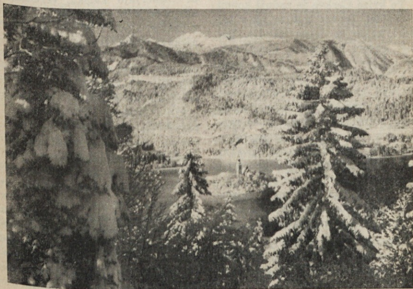
Naš Bled s cerkvico pozimi

Sklicujoč se na same koncilске dekrete in konstitucije, ki jih razlagajo po svoje, pa so mnogi katoličani začeli v Cerkvi spreminjanje, ki ga koncil ni imel v mislih in ga po vsej pravici lahko imenujemo prevratno in revolucionarno. Papež Pavel VI., ki mu je dana težka naloga, da sklepe koncila v življenju Cerkve uveljavi, ponovno opozarja na to prevratno gibanje in v enem svojih nagovorov takole zaskrbljen toži: „Naša generacija se čuti kakor