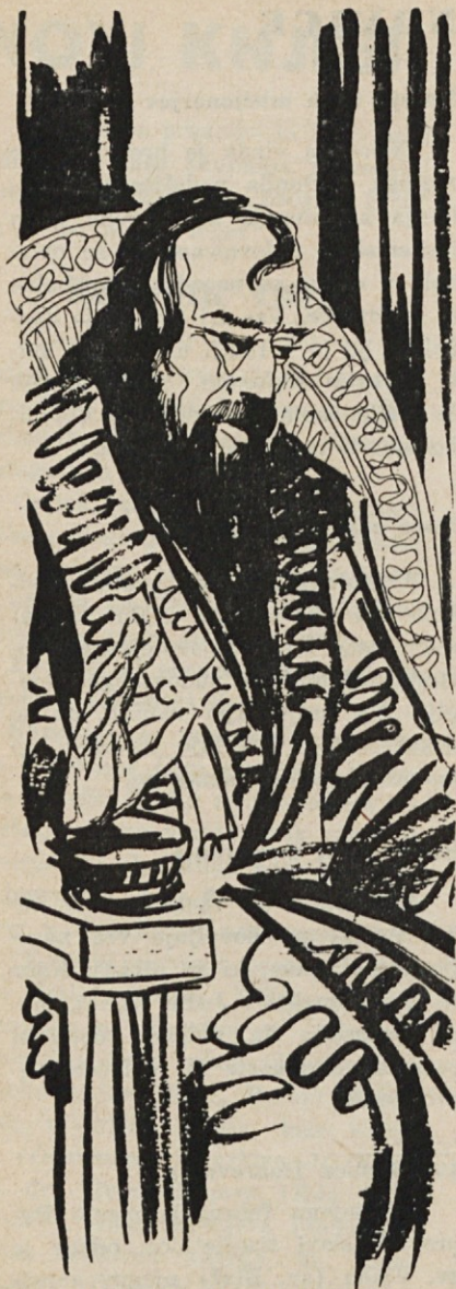
Morris West - Pavle Rant Ilustriral: Hotimir Gorazd

Papež se je nasmehnil, ko je zapiral ovojnico. Goldonija in Kurijo bodo prevzeli dvomi in strah pred bodočnostjo. Sklicevali se bodo na zgodovino in protokol pa na vse možne politične posledice. A papež Ciril je bil izvoljen, da bi vladal v imenu božjem in v tem imenu bo tudi vladal.