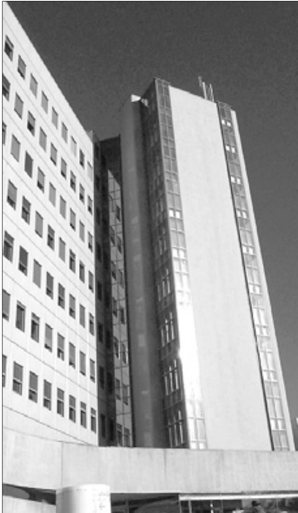
Šempetrska bolnišnica (levo) in njen porodniški oddelek (desno)

Zgodovinski sporazum med šempetrsko bolnišnico in zdravstvenimi oblastmi iz FJK