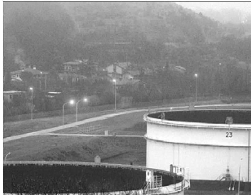
Zbiralniki nafte podjetja Siot pri Krmenki