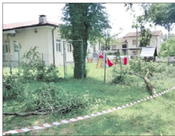
Odlomljeno vejevje ob doberdobskem vrtcu (levo); gasilci odstranjujejo izrevano drevo (desno)