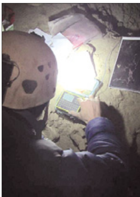
Pošiljanje SMS sporočil prek radijskih valov