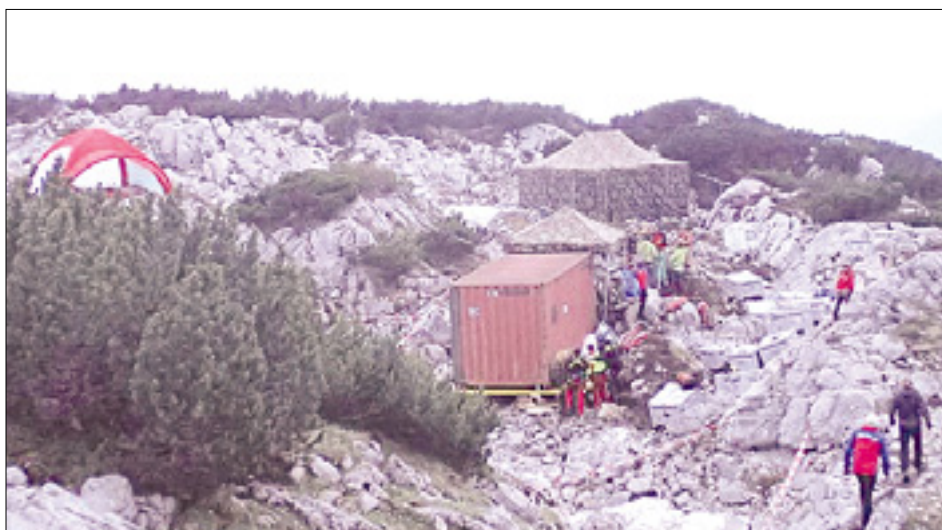
Logistični tabor pri vходу v jamo