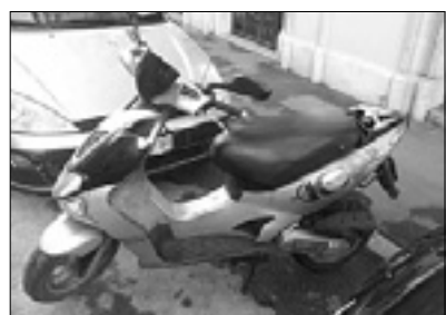
Skuter spretnega tatu

Policisti goriškega letечеge oddelka in karabinjerji iz Gradišča so skupaj speljali do konca preiskavo, v okviru katere so ugotovili istovetnost tatu, ki je ukradel torbico 59-letni kolesarki. Ženska je 29. maja kolesarila po Ulici Emigrante proti domu, ko se ji je nenadoma približal skuter, ki ga je upravljal neznanec. Skuterist je sunkovito iztegnil roko, zagrabil torbico, ki jo je ženska položila v koš pred krmilom, in odpeljal. Kolesarka je takoj prijavila tatvino karabinjerjem, ki so sprožili preiskavo skupaj s policisti letечеge oddelka. K uspehu preiskovalnega dela je odločilno prispeval očividec, ki je prisostvoval dogodku; možje postave so