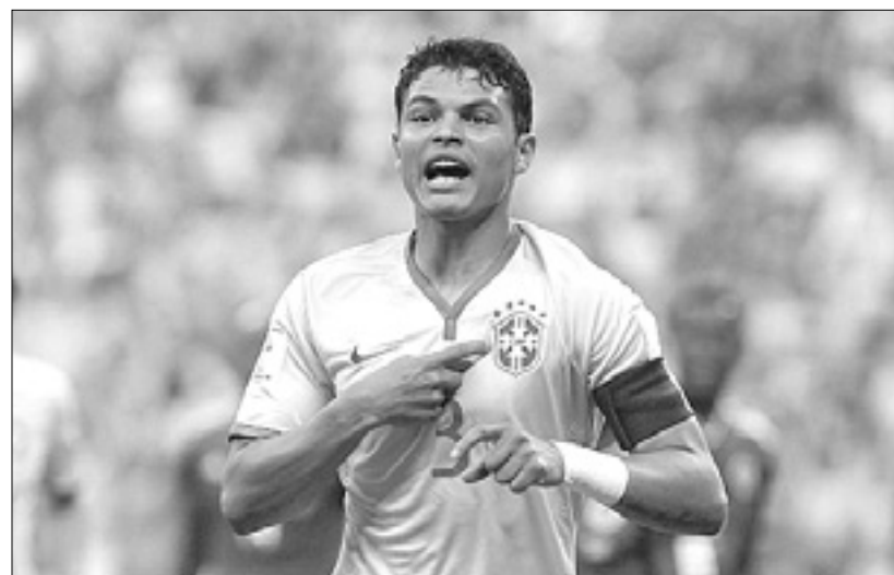
Thiago Silva odlično branil in zabil gol