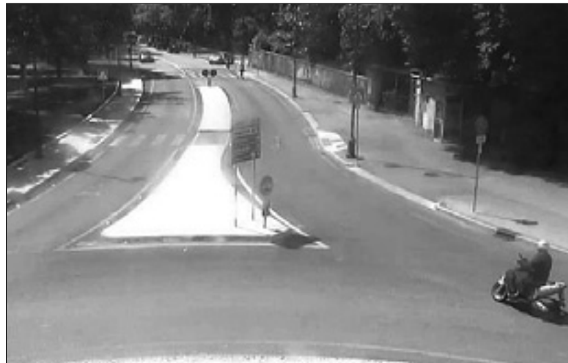
Videokamere so možkega posnela kmalu po tatvini

mu pokazali nekaj fotografij ljudi, ki so v preteklosti že imeli težave s pravico, na njih pa je brez težav prepoznal možkega, ki je ukradel torbico kolesarki. V četrtek so se policisti in karabinjerji od-