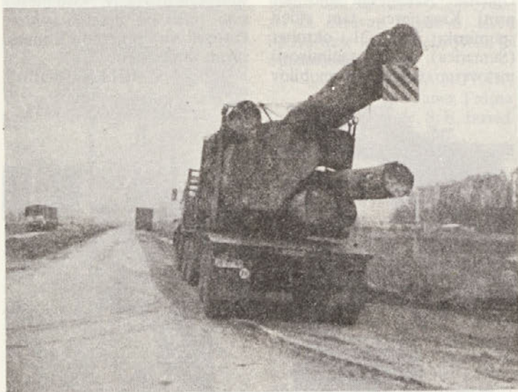
Kadar nismo sami v preveliki stiski za prevoz, z našimi kamioni prevažamo tudi uvožen afriški les za novolesovo skladišče v Straži. En sam hloed na tem kamionu je meril devet kubičnih metrov.

V Švici so proučevali odpornost posameznih drevesnih vrst proti škodljivim plinom iz industrijskih obratov. Najbolj škodljive so zmesi, ki vsebujejo fluor. V najbolj ogroženih področjih priporočajo (kot najbolj odporne) jerebiko, robinijo, trepetliko, brezo in macesen. Manj so odporni bukev, hrast, jesen, javor in lipa.