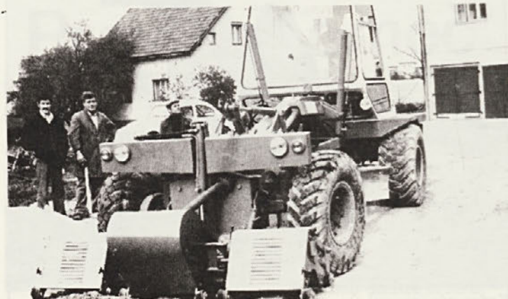
Novi greder, ki ga je pridobil tozd „gradnje in transport“ velja 200 milijonov. Nanj je pritrjen tudi vibrator, tako da bo opravljal dvoje del: vzdrževanje že zgrajenih cest in utrjevanje novih.