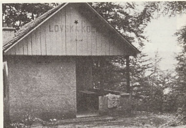
Lovska koča LD Šentjerneje na Pragu. Tu je bil 13. maja 1942 ustanovljen Gorjanski bataljon. Včasih nudi zatočišče tudi gozdarjem.