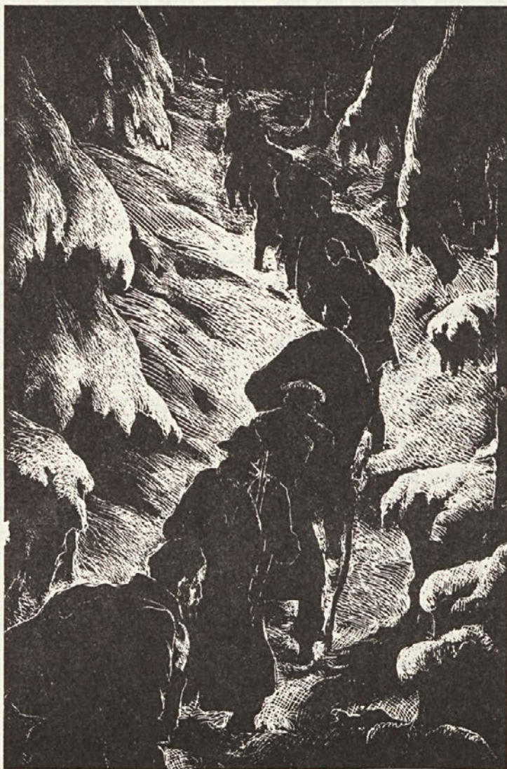
B. Jakac: Odhod slovenske delegacije iz Kočevskega Roga. Visoka jedkanica.