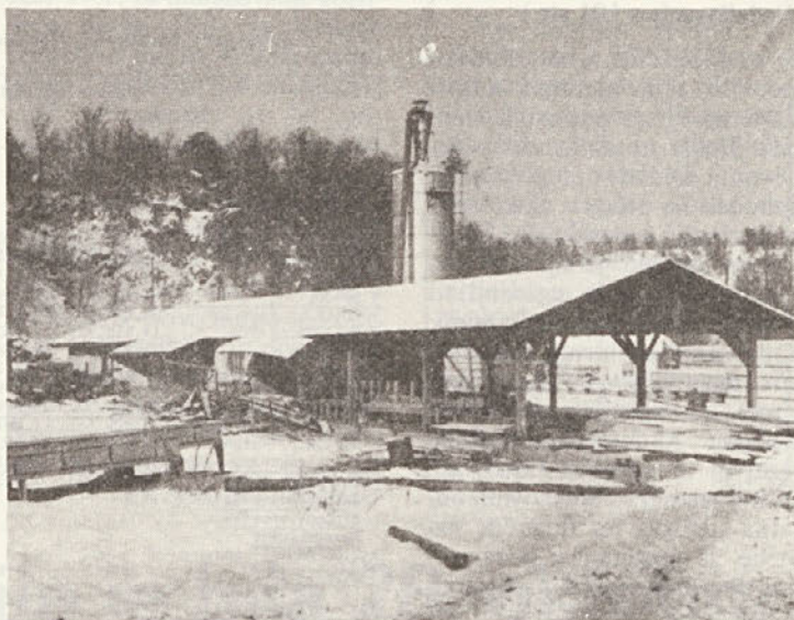
Žaga v Pogancih je tudi pripomogla, da je bil poslovni uspeh TOZD Gozdarstvo Novo mesto ob tričetrletju tako ugoden. Fotografiral je Jure Krampelj leta 1978, ko so rekonstruirali transportne naprave.