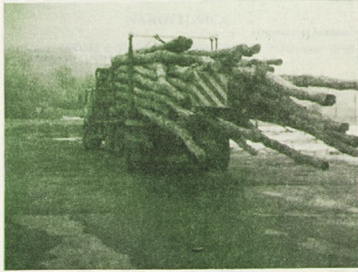
Včasih imajo vozniki naših tovornjakov še posebno težko nalogo. Na tem kamionu so kostonjevi drogovi dolgi kar šestnajst metrov, kar že ni več v skladu s prometnimi predpisi.