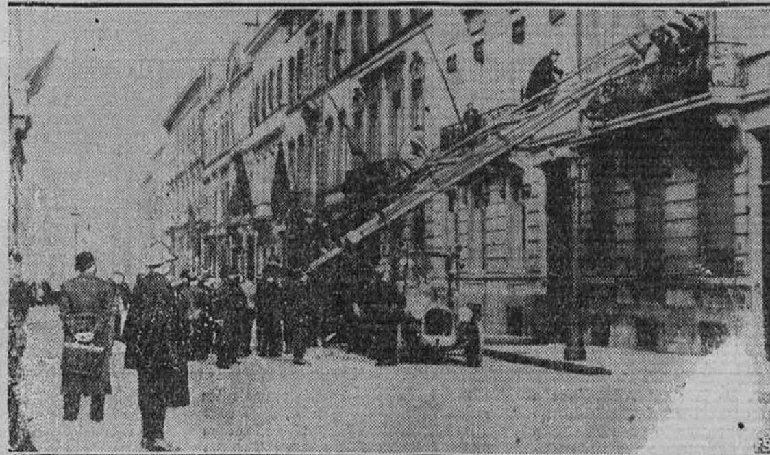
Kmalu po zavzetju Barcelone so pristaši nacionalistov v belgijski prestolici Bruselj zasedli španski konzulat. Ker pa njih vlada še ni bila od države uradno priznana, je mestna policija splezala po lestvi skozi okno v poslopje in jih od tam izgnala.