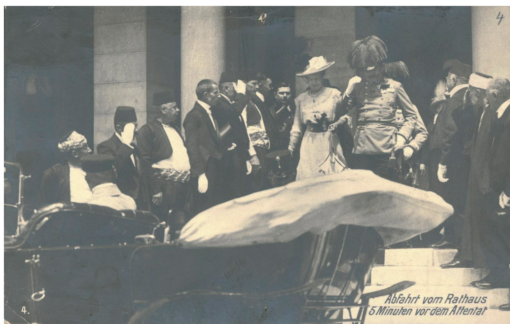
fotografija nadvojvode Franca Ferdinanda in njegove soproge Zofije – pet minut pred atentatom.

Bosanska kriza je prva nakazala, kje utegne biti najverjetnejše vnetišče Evrope. 5 Obisk nadvojvode Franca Ferdinanda z nosečo soprogo Zofijo v Sarajevu je bil odkrita potrditev cesarske oblasti v nedavno anektirani pokrajini. Namenoma je prezrl vsa opozorila 6 in obisk načrtoval tako, da se je prekril s srbskim narodnim praznikom – vidovdanom 7 , obletnico kosovske bitke. V očeh Srbov je šlo za preračunano žalitev. 8 Zato so se med množicami, ki so ju prišle pozdraviti dne 28. junija 1914, skrivali tudi mladi atentatorji, ki jih je poslala ena od tajnih srbskih organizacij, ki so nasprotovale habsburški vladavini – Mlada Bosna. Po eksploziji prve bombe, je bilo ranjenih nekaj gledalcev, med njimi tudi policist, aretiran je bil en mož. Nekaj časa pozneje, se je avtomobil z nadvojvodo ustavil neposredno pred devetnajstletnim Gavrilom Principom. Le-ta je izkoristil priložnost, izvlekel pištolo in dvakrat ustrelil. Krogle iz Principovega revolverja, izstreljene iz neposredne bližine, so smrtno ranile cesarski par.