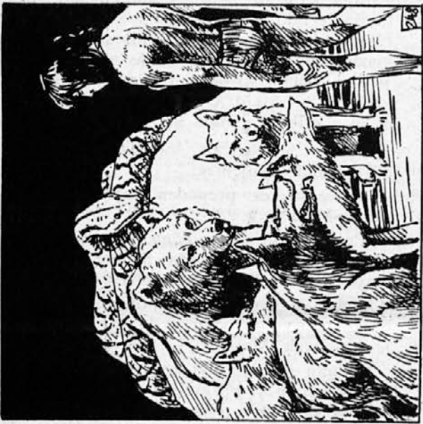
248. In ko je Mavgli s težkim srcem prišel na kraj, kjer je bil nekoč sprejet v krdelo, je našel tam samo svoje štiri brate volkove, Baluja, ki je od starosti že skoraj oslepel, in veliko Kajo, ki se je zvilila okrog praznega Akelovega sedeža. »To rešje se bo tule končal tvoj sled, človeček?« je žalostno nagovorila prijateljca.