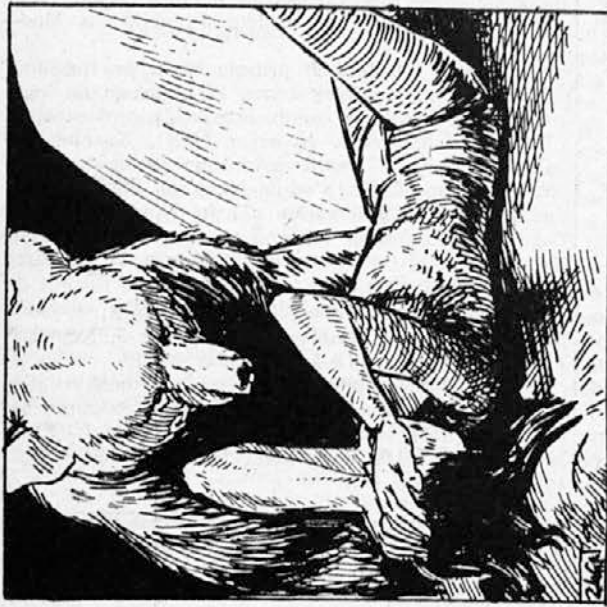
249. Mavgli se je vrgel na tla in si pokril obraz z rokami. »Zakaj me niso raztrgali rdeči psi?« je zastokal. Balu je počasi dejal: »Prav je imel Akela, ko je pred smrtjo povedal, da bo Mavgli izgnal Mavglitja nazaj k človeškemu krdelu. Tudi jaz pravim tako.« Kaja se je zganila: »Človek se napesled vrne k človeštvu, četudi ga džungla ne izganja!«