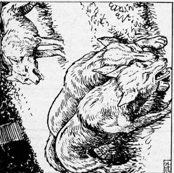
247. V vsakem drugem letnem času bi se ob novici, da Mavgli zapuška džunglo, zbrala na Skali sveta vsa džungla z naježenimi tilniki. Zdaj pa so vsi gozdni prebivalci prepevali, plesali in se borili. Komaj so se zmenili za novico, ki jim jo je sporočal Sivi brat. »Ej, mar je zato čas nove govoriče manj lep?« so mu odgovarjali.