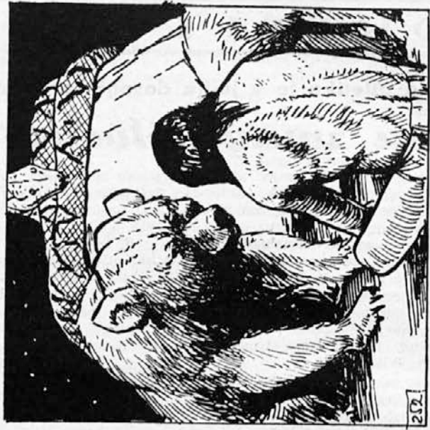
252. Balu je modroval: »Saj se ne poslavljaj od nas kot človeški mladič, ki so ga sprejeli v sijo nijsko krdelo. Odhajaj kot gospodar džungle, ki menja svoj sled. Kdo sme povpraševati človeka po njegovih poteh? Daleč je že čas, ko te je Baghira odkupil z bikorn in volkovi, ki so sprejeli odkupnino, so z Akelo vred že zdavnaj mrtvi.«