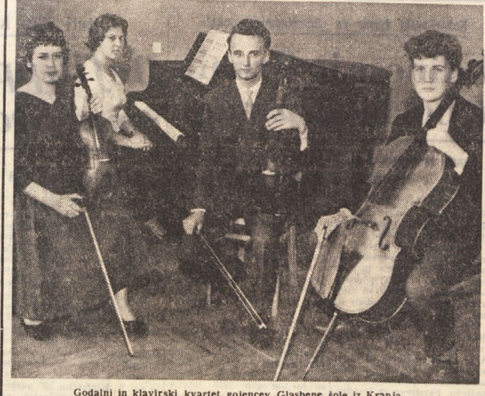
Godalni in klavirski kvartet gojencev Glasbene šole iz Kranja