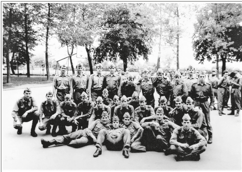
Drugi vod NPC ŠRO JLA, 79. klasa, junij 1984, Šentvid pri Ljubljani.

izkoristili za učenje. Tik pred 22. uro je bila priprava za spanje, delo redarjev in obhod prostorov dežurnih v enoti. Od 22. ure do 6. ure zjutraj je bil ukazan počitek. Pogasnile so se luči, za to so bili odgovorni dežurni v osnovnih enotah in njim nadrejeni v vojašnici. Izjema smo bili pitomci , ki smo se lahko učili v učilnici, in seveda razne uzbune , 47 ki pa jih ni bilo veliko.