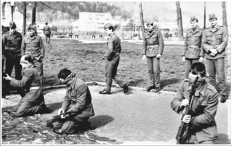
Tekmovanje pitomcev ŠRO v razstavljanju in sestavljanju PAP miže. Zeleni poligon kasarne Boris Kidrič v Šentvidu pri Ljubljani aprila 1984.

i pravila gađanja pokretnih ciljeva streljačkim naoružanjem), ... za izvođenje na- stave iz taktičke obuke (Različne teme: Rad i postupci vojnika u borbi, Streljačko odeljenje u odbrani, Ojačani streljački vod u odbrani ...) in še mnogo drugih. Deli podsetnika so bili: glava, tema, cilj, nastavna pitanja, metod rada, vreme rada, literatura, tip časa, oblik rada, mesto rada i material. Delo je bilo organizirano tako, da smo se pitomci izmenjavali v vlogi vojakov in komandirjev oddelkov in tako v praksi preizkušali znanje in sposobnosti, ki smo jih pridobili v učnem procesu in ga bomo seveda morali znati uporabljati v drugem delu služenja voja- škega roka, ko bomo po Jugoslaviji stažirali v enotah JLA. Teorijo smo preverjali v praksi na zelenom poligonu u krugu kasarne, na poligonu uz Savu in na Toškem čelu v okolici Ljubljane. Vrhunec praktičnega dela pouka je bilo večdnevno lo- gorovanje. 49 Na njem smo dodatno utrjevali pridobljeno znanje in izvajali bojno streljanje z orožjem, ki smo ga imeli na razpolago. Iz posebej prirejenega zaklona smo metali ročne bombe. V vseh vremenski razmerah smo izvajali dolge pohode in jurišali na nasprotnikove položaje v hribih. Preživeli smo močno sonce, veter, dež in sneg, posledično s tem pa precej blata na poligonih. Še najbolj zoprno je bilo v ledenem dežju in zelo napadalnem mrčesu. Tudi zaradi tega si bom dobro zapomnil imena krajev Poček, Žerible in Bač v okolici Postojne in Pivke.