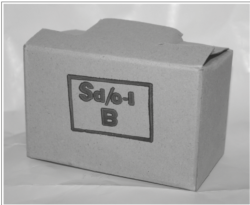
Suhi dnevni obrok v JLA.

Hrana v vojašnici v Ljubljani. Zajtrk, kosilo in večerjo smo imeli v jedilnici, dopoldansko malico pa navadno v učilnici. Spominjam se, da smo za kosilo imeli tri menije, a žal smo imeli pitomci le redkokdaj možnost izbirati med vsemi. Zaradi dolgega pouka smo prišli pozno na kosilo in seveda dobili od kosila le tisti meni, ki je ostal. Hrane je bilo dovolj ter v zadostni količini in kvaliteti, tako da ni bilo pretirane potrebe po prošnjah domačim za pošiljanje hrane. Menim, da je bila hrana prilagojena širšem okolju, v katerem je delovala vojašnica. So mi pa ostali v spominu razkuhan riž in gumijaste ribe. Takrat smo odšli v kantino in pokupili napolitanke in razne kekse. JNA je poznal tudi SDO-je. 54 To so bile škatle iz lepenke z različno konzervirano hrano od konzerv fižola do vočnih kock . Škatle so bile označene s črkami A, B, C, D, E ... in vsaka takšna škatla je imela drugačno vsebino. Zraven si dobil še tetrapak s sokom različnih okusov. Datumi konzerv so bili različni, od svežih do zelo oddaljenih. Na logorovanju smo dobili konzerve z datumom mojega letnika. Najprej nismo vedeli, ali bi jih pojedli ali ne? Ko pa smo jih odprli, je iz njih prijetno zadišalo. Mesni doručak je bil iz najboljšega mesa in brez masti. Pojedli smo jih s slastjo. 55 Nikakor pa nismo mogli