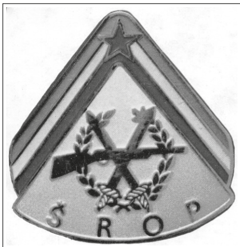
Znak šole rezervnih oficirjev pehote JLA iz leta 1984 (osebni arhiv).

družbenopolitične skupnosti za to smer študija namenjale večje število štipendij. Konec istega leta je vrata odprla tudi vojaška gimnazija Franc Rozman – Stane v Ljubljani.