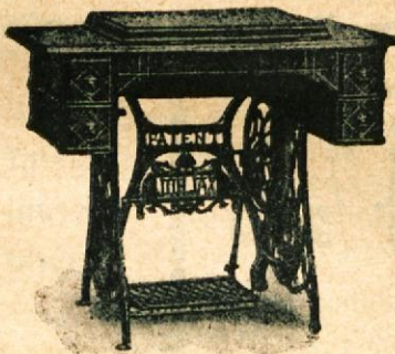
Ceniki na zahtevo zastoj.

Razglas. C. kr. deželna vlada za Kranjsko je na podlagi § 5. min. naredbe z dne 19. decembra 1914. št. 345 drž. zak. odredilada se zahtevajo vse v tukajšnjem političnem okraju se nahajajoče razpoložljive zaloge krompirja za preskrbo pomanjkanja trpečega prebivalstva na Kranjskem in je zavezala posestnike zalog krompirja, da jih morajo v to svrho po oblastveno določenih najvišjih cenah dobavljati „Gospodarski zvezi v Ljubljani“. Od te dolžnosti so izvzete one množine krompirja, ki jih rabijo posestniki za svojo domačo potrebo in za nadaljevanje gospodarstva. Ako bi se posestnik branil dobavljati svoje zaloge „Gospodarski zvezi“ prodalo bi jih okrajno glavarstvo na njegov račun in stroške. V izvršitev te odredbe zapleni okrajno glavarstvo vse zaloge krompirja, kar ima za posledico, da je vsaka prodaja krompirja kamorkoli najstrožje prepovedana. Prestopki kaznovali se bodo brezobzirno z globami do 5000 K ali z zaporom do šest mesecev.