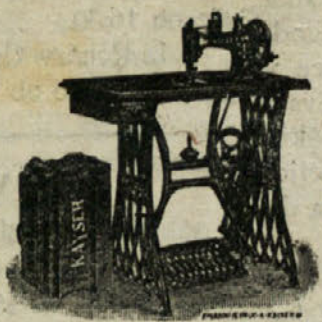
Šivalni stroji nemških tovarov „NEUMANN“ najboljših vrst, 101 jamči po najnižjih cenah.