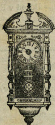
Stena ura s tekom 8 dni Lir 75.-

Bogata izbira nožev in sploh namiznega orodja, kakor tudi profumov najboljšje vrste.