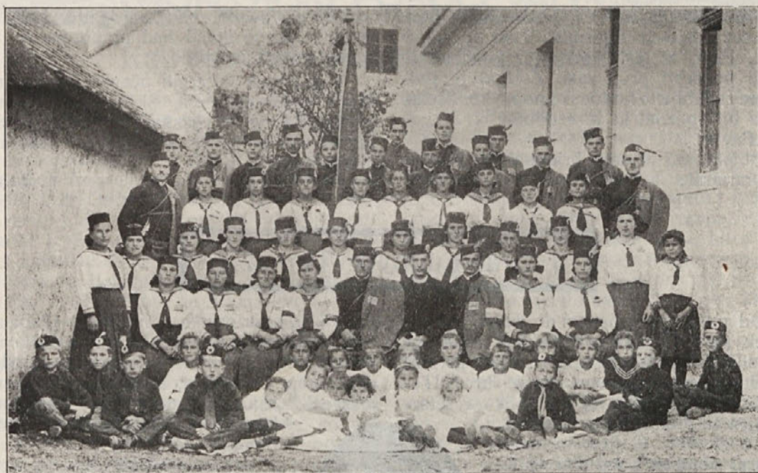
Orlovska družina v št. Vidu pri Kostanjevici.

„Anina misel pa ni neumna. Peter, povej ji, zaradi nje, ne zaradi njega, dali mu ga bomo, če bodo drugi bratje zadovoljni. To je namreč, da je najlepši in najpripravljeni za ta častni posel.“