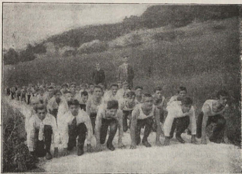
Tekmovalci okrožja Trbovlje pred tekom 100 m.