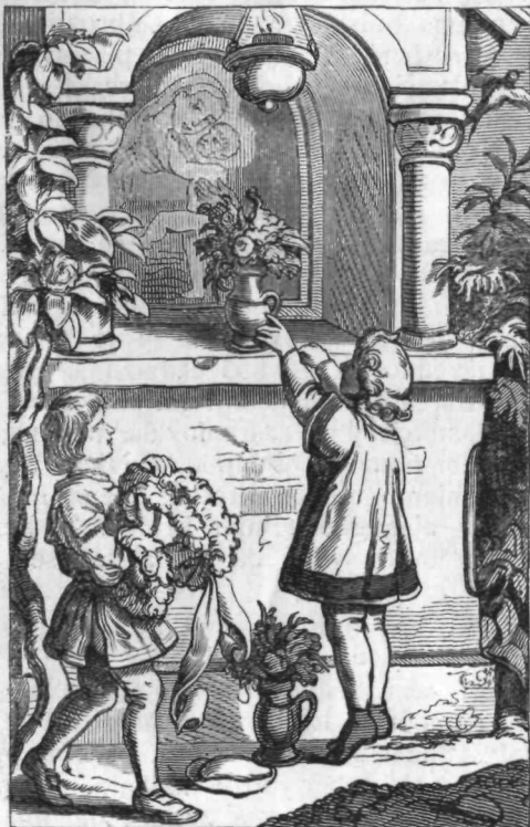
Sv. Francišek Saleški zaljša Marijin altar.

sv. očeta za Marijinega otroka na zemlji, v nebesih to potrdi Jezus Kristus. Tako si pravi otrok Marijin! Glej, kolika sreča te čaka v Marijini družbi!