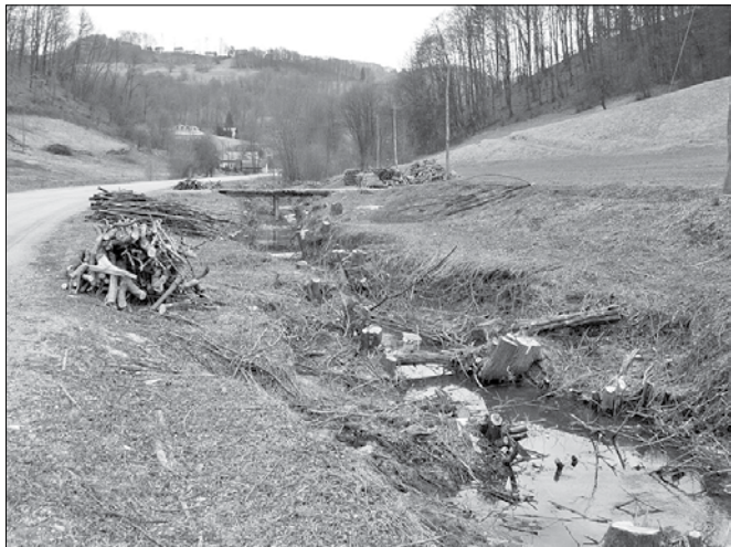
Neprimerna popolna odstranitev obrežne vegetacije

Posamezna drevesa, lesna vegetacija v obliki linij (mejice, obvodna drevnina) in sadovnjaki predstavljajo edino obliko visoke vegetacije v odprti kmetijski krajini. Ta vegetacija ima veliko pozitivnih učinkov tudi na kmetijske površine.