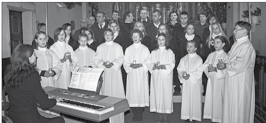
Ob zaključku koncerta so Sveti noč zapeli vsi zbori skupaj.