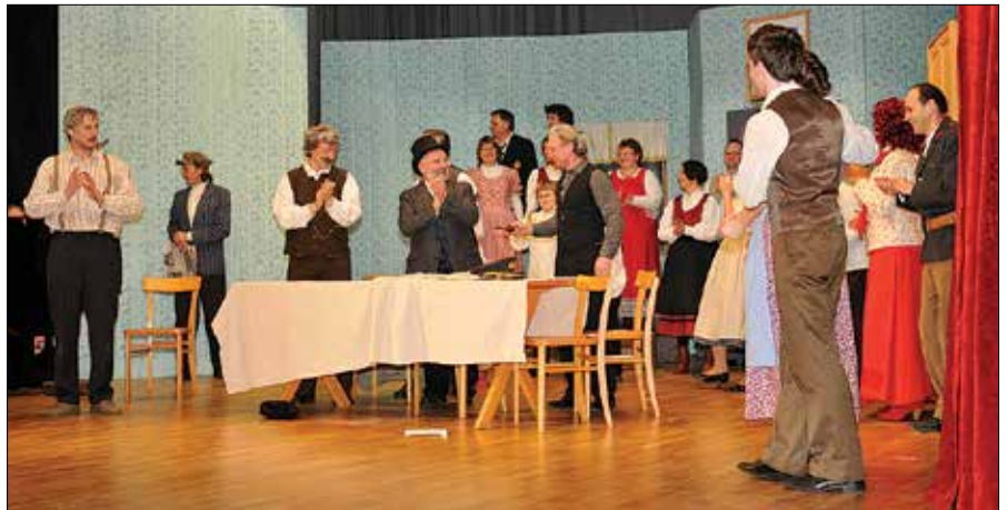
Na oder je stopilo preko trideset igralcev in pevcev.