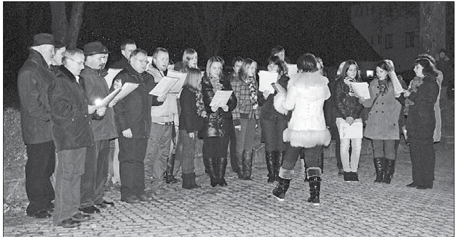
Odrasli cerkveni zbor je prepeval božične napeve.