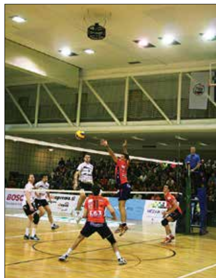
Odbojkarji ACH Volleyja so na mreži zaustavili večino poskusov nasprotnikov, da bi jim ogrozili zmagovalni pohod do naziva pokalnega zmagovalca.

Večerna tekma med odbojkarji OK Maribor in ACH Volley je bila precej manj razburljiva, saj Ljubljancani Maribočanom niso pustili dihati. Tekma je bila kljub temu vredna ogleda in navi-