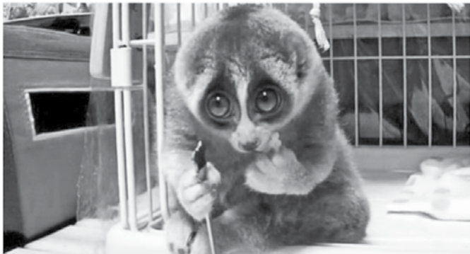
Dajte no, ali bi bile lahko tele nedolžne očke krive?

Ker v našem sodnem sistemu že ne morejo biti podkupljeni ali opravično nesposobni ljudje, je edina možna razlaga, da skoraj nikogar od večji osumljencev ne obsodijo, ta, da kot pri nekaterih športih tudi v sodstvu nimajo dovolj navijačev.