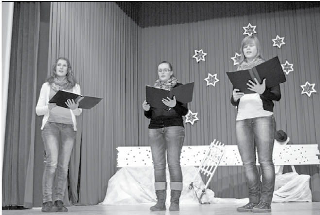
Sestre Lamprečnik so popestrile program z ubranim triglasnim petjem.