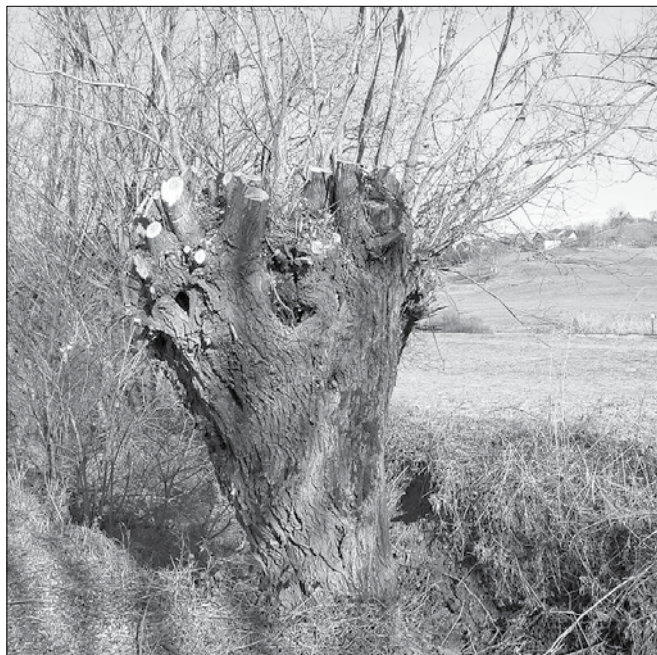
Obrezovanje in ohranjanje glavatih vrb

• V obrežno vegetacijo se posega zgolj na eni strani brežine, na drugi strani pa ne prej kot v razmiku dveh let.