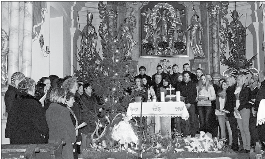
Sveto noč so zapeli vsi pevci skupaj.

vrenca so zazveneli praznični napevi treh domačih zborov in okteta Žetev. Misli o praznikih, božiču in glasbi je s poslušalci delila Tadeja Robnik.