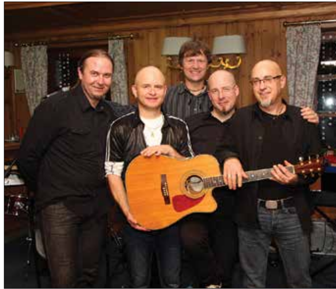
Happy band v sedanjem sestavu uspešno nadaljuje glasbeno kariero.