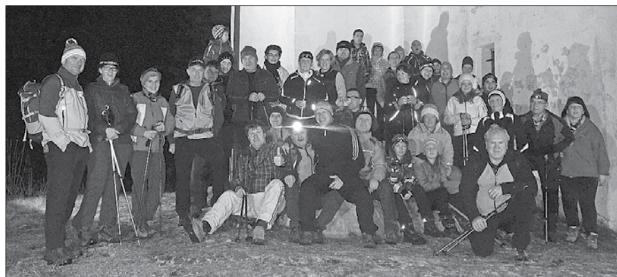
Po besedah udeležencev je na predbožičnem pohodu manjkal le sneg.

Že drugo leto zapored so člani športnega društva Veterani iz Gornjega Grada organizirali predbožični pohod na Semprimož. V petek, 23. decembra, se je 39 pohodnikov na večer odpravilo na priljubljeno pohodniško točko. Najmlajši udeleženec je štel tri leta in najstarejši 75.