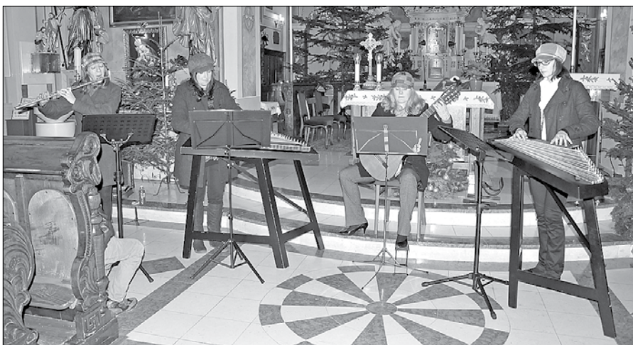
Najljubši skladbi članic kvarteta Štiriangel, ki so ju zapele in zaigrale tudi v Mozirju, sta Le verjemi in Ave Marija.