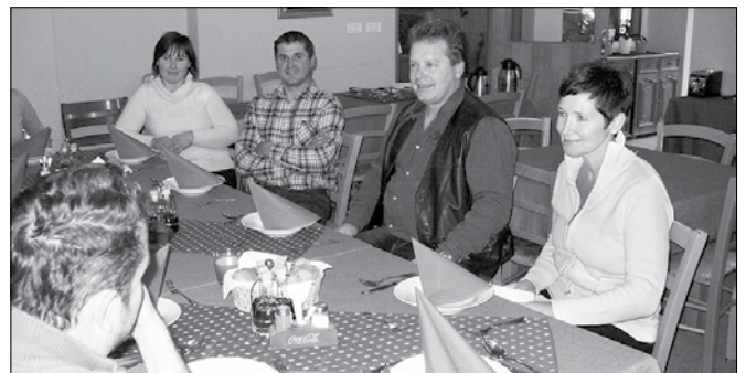
Ob zaključku delavnice so si vsi zaželeli, da bi bilo teh čim več, saj staršem terapije pomagajo pri preživljanju obdobja bolezni njihovih otrok.

Člani društva so med sabo zelo povezani, saj jih družijo skupna izkušnja diagnoze, ki jim je popolnoma spremenila življenje. Ob zaključku delavnice so si zaželeli, da bi bilo teh čim več, saj jim terapije pomagajo pri preživljanju obdobja bolezni njihovih otrok, pa tudi kasnejšega obdobja, ko v njih ostaja nenehni strah po povrnitvi bolezni. Aktivni so tudi na pediatrični kliniki, kjer