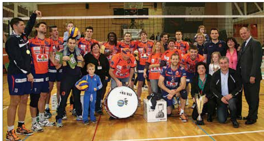
Zmagovalna ekipa ACH Volley skupaj z organizacijsko ekipo OK Mozirje.

janja mnogih, v oranžne barve odetih navijačev.