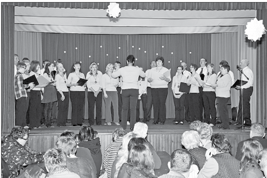
Pevci in pevke so združili moči in zapeli dve božični pesmi.