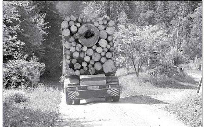
S prevoznico ali brez, les odvažajo iz naše doline.

se bodo leseni izdelki prvič dali na trg, se začasno skladiščili pred dajanjem na trg ali pa bodo namenjeni za lastno uporabo. Prevoznik bo prevoznico prejel od lastnika gozda, temu pa jo bo na podlagi izdanega dovoljenja za posek dreves najverjetneje izdal Zavod za gozdove Slovenije. »V kolikor lastnik gozda ne bo imel odločbe za posek ali bo preselel posekano količino, prevoznice ne bo mogel dobiti,« je dejal Breznik.