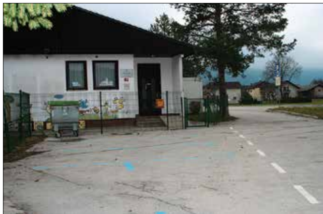
Modre cone so namenjene kratkotrajnemu parkiranju.

Minulo jesen so v Nazarjah v okolici osnovne šole in vrtca preuredili tamkajšnje parkirišče. Zarisali so modre cone in tako rezervirali prostor za kratkotrajno parkiranje do 15 minut, predvsem za starše, ki pripeljejo otroke v vrtec. Na omejenem delu je bilo ozko grlo, kjer sta se dva avtomobila težko srečala, saj so bila vozila parkirana brez pravega reda.