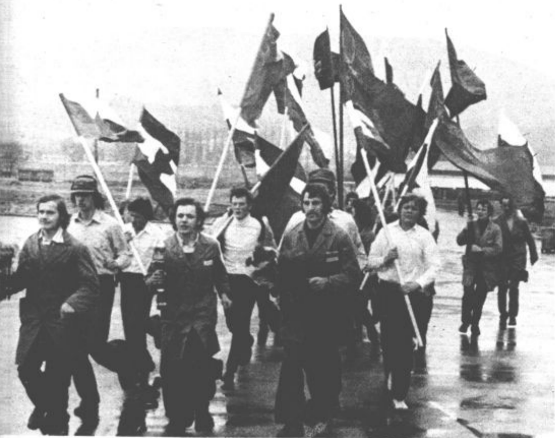
Vsako leto tudi mladina, delovni ljudje in občani naše občine pospremijo štafeto mladosti z najlepšimi željami dragemu tovarišu Titu za njegov rojstni dan. Tako bo tudi v nedeljo, ko prispe zvezna štafeta mladosti v našo občino.

Poglaviti smoter skupnega delovnega dogovora je poglobljanje samoupravljanja, uveljavljanje dohodkovnih odnosov, intenziviranje dela, dvigu produktivnosti in dosegi še boljših rezultatov gospodarjenja.