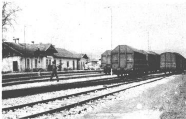
Pa srečno pot!

želijo pa tudi izboljšati kvaliteto svojih storitev. Srednjeročno pa bodo morali razmišljati tudi o novi železniški postaji, saj se mesto širi tudi v to smer in je torej širšega družbenega pomena predstavitev tega objekta iz