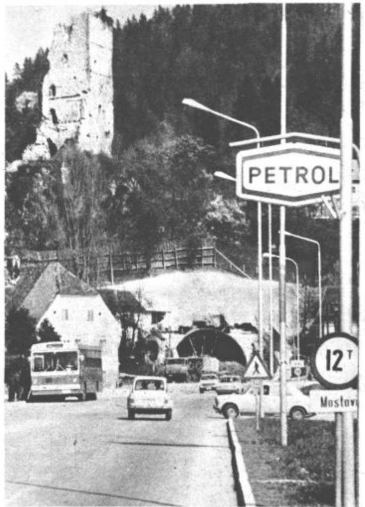
Dela pri gradnji cestnega predora skozi hrib, na katerem stoji šaleški grad dobro napredujejo in predor je vse bolj viden. Kot smo že poročali ga bodo delavci REK Zasavje – tozd rudarska gradbena dela zgradili do letošnjega praznika občine Velenje. (S. V.)

Praznik dela – 1. maj bodo naznanile budnice godb na pihala, člani delovnih kolektivov iz Velenja in Šoštanja pa bodo odšli na že tradicionalne prvomajske izlete do bližnjih planinskih in turističnih postojank ter krajev, znanih iz časov NOV.