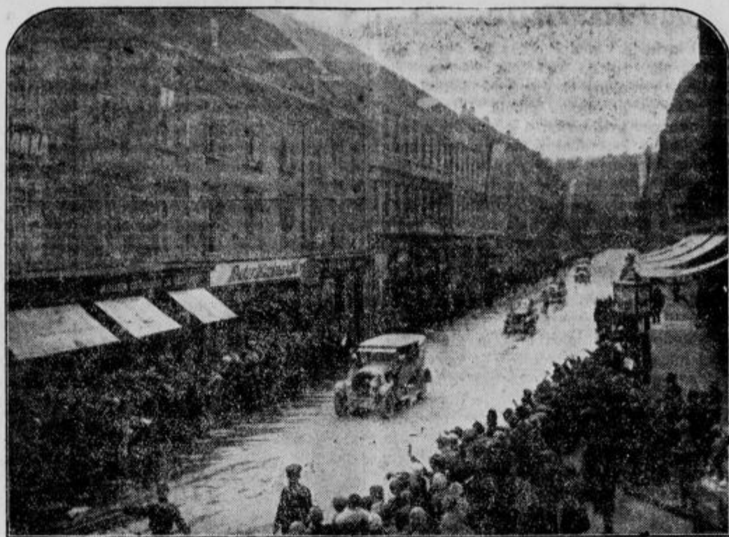
K obisku nemških avtomobilistov v Sloveniji: prvi avtomobili na Aleksandrovi cesti v Ljubljani, pozdravljani od množice.