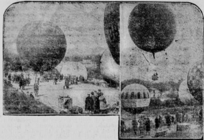
Z zanimive tekme 9 balonov iz Pariza

doлина Rodana, ki se je vsrila pred nekaj dnevi. - Slika nam kaže prizor ob priliki dvigavanja s pariškega letališča.