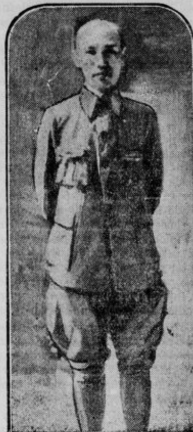
Kitajski general Čang-kaj-šek.

pred vojno glavno nemško postojanko na Kitajskem. Mesto se ponovno omenja tudi pri sedanjih zmedah.