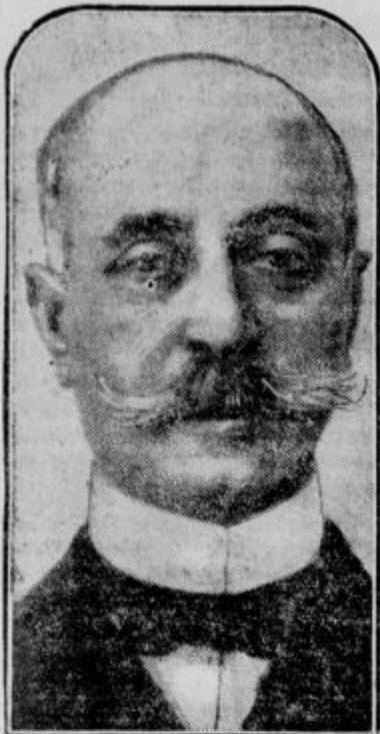
Admiral Konduriotis, predsednik grške republike, ki je po- dal te dni ostavko, a vrši na prošnjo vlade svoje posle začasno še naprej. Za njegovega naslednika predlagajo nekateri Venezelosa.