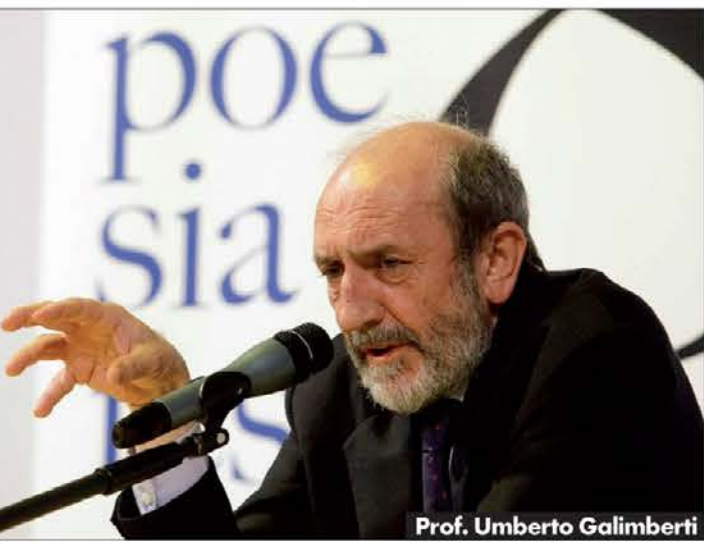
Prof. Umberto Galimberti

svoboda-ujetništvo) pripisal oziroma prepustil božjemu. Ko človek občuje z božjim, znori (kot zgovorno opisujejo Bahantke). Bog in božji svet se zatorej nahajata onkraj človeških zakonitosti dobrega in zlega, skratka etike. Kako naj si človek s svojim razumom lahko sploh razlaga zahtevo Boga, naj Abraham žrtvuje svojega