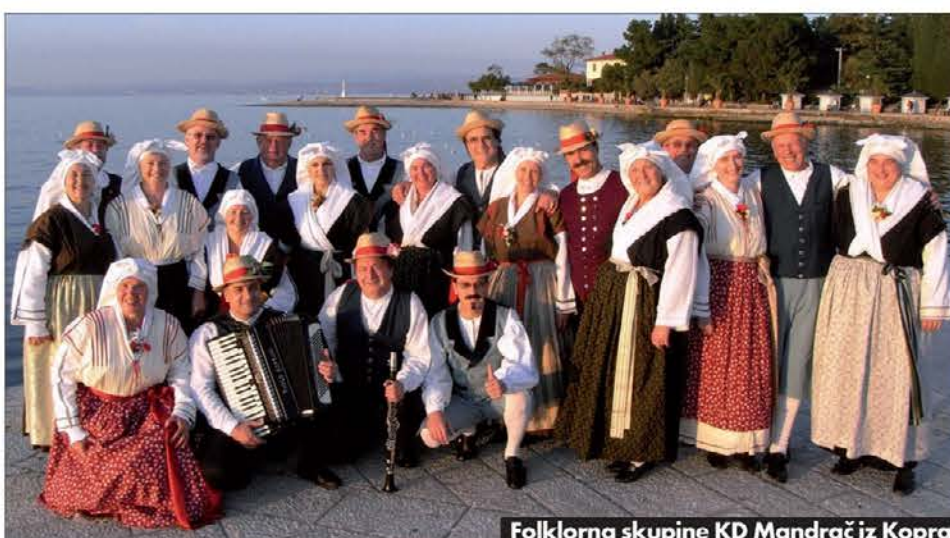
Folklorna skupine KD Mandrač iz Kopra

ve proslave prirejamo predvsem zase. Po njenih besedah celo osrednjo proslavo nista v društvu