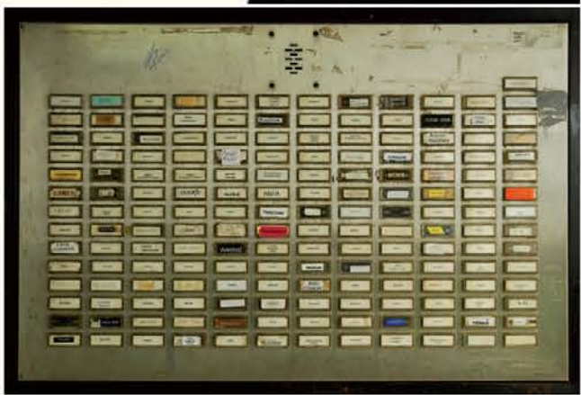
Brez naslova, 2012, originalni ink jet print, 2012, 50x00D770cm. jpg

ena dominantnih rdečih niti vleče spraševanje o identiteti, lastni in tuji, in o odnosu te lastne bitnosti z drugimi in s širšim okoljem. V mestni galeriji Nova Gorica se predstavlja z novo serijo fotografij, ki jo je poimenovala Brez naslova .